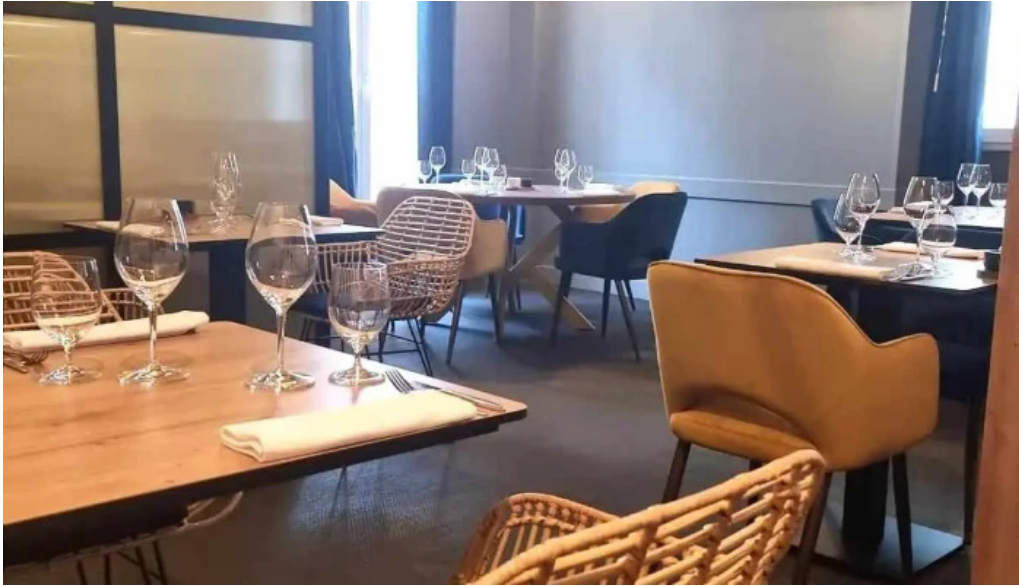
Vins paradoxe restaurant a niort tout