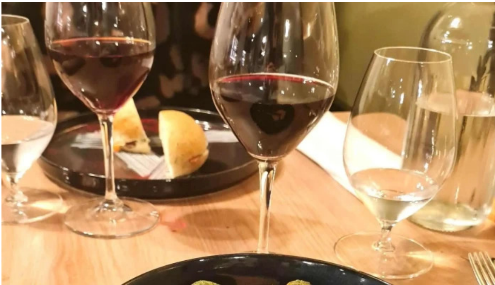
Vins paradoxe restaurant a niort niort