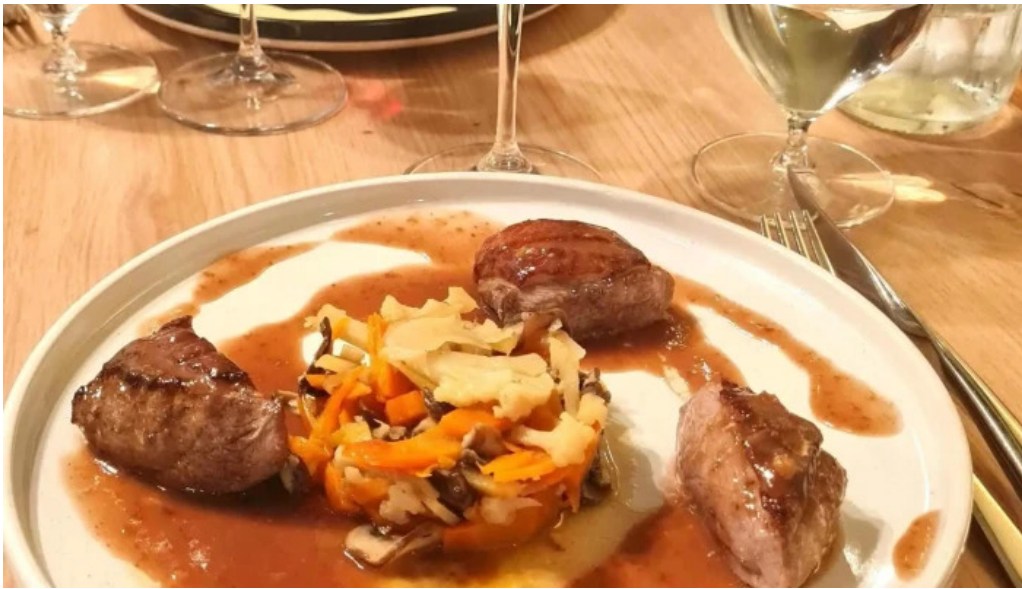
Vins paradoxe restaurant a niort numero