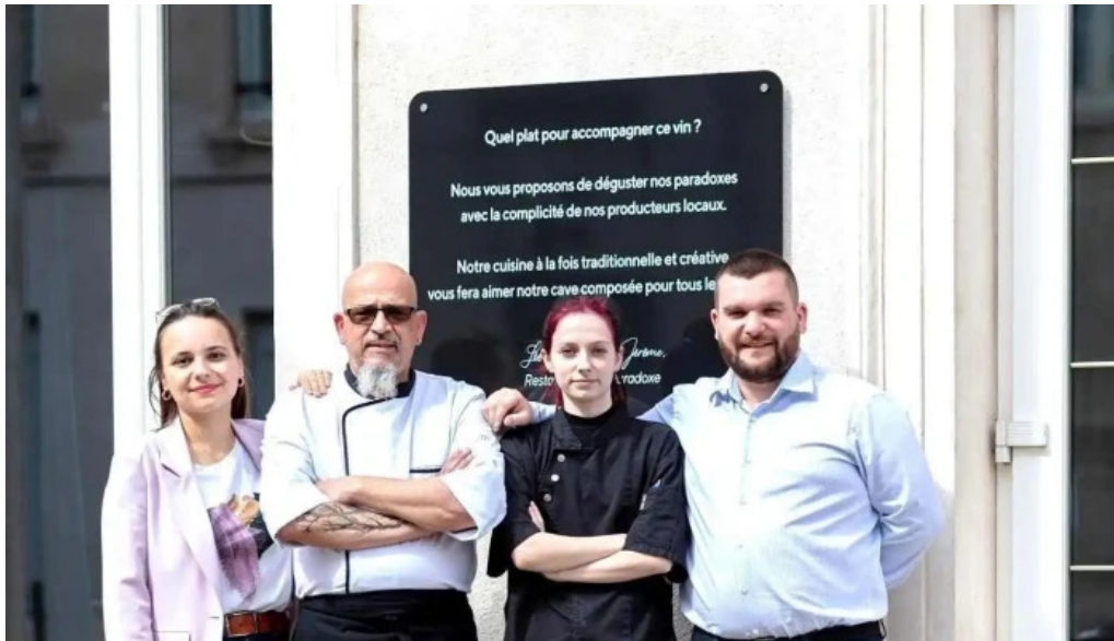
Vins paradoxe restaurant a niort photos du proprietaire