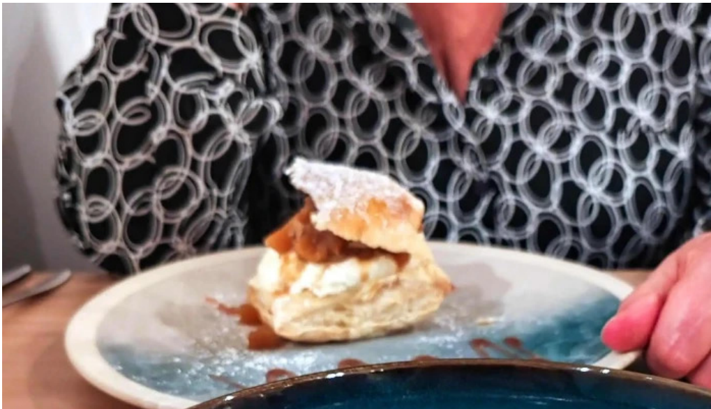
Vins paradoxe restaurant a niort zone