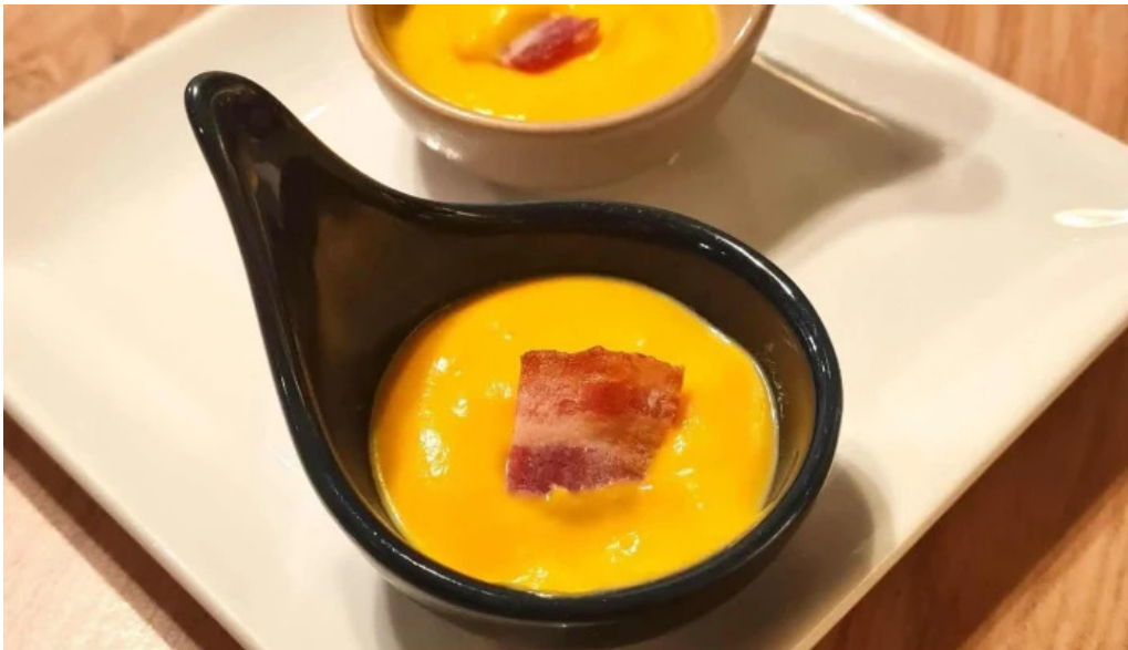
Vins paradoxe restaurant a niort restaurant