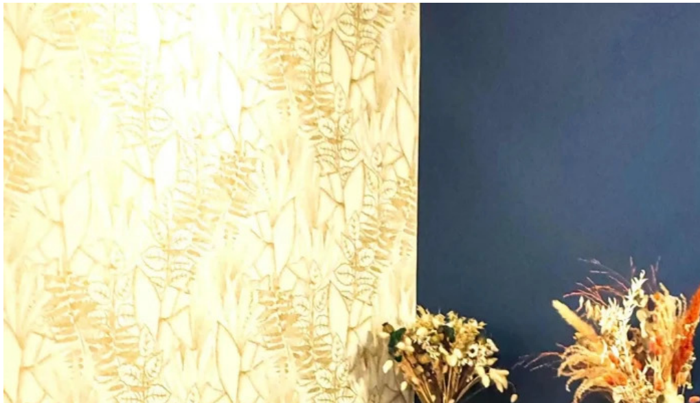
Vins paradoxe restaurant a niort opinions