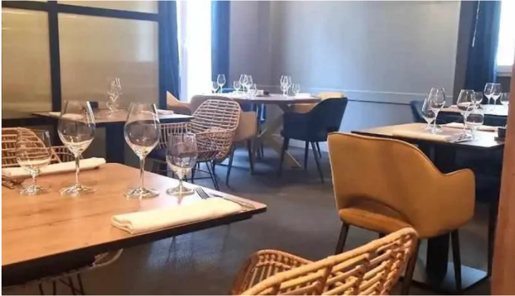
Vins paradoxe restaurant a niort niort