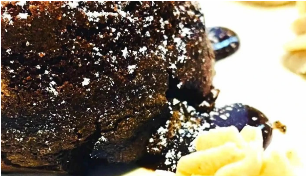
Vins paradoxe restaurant a niort plats et boissons