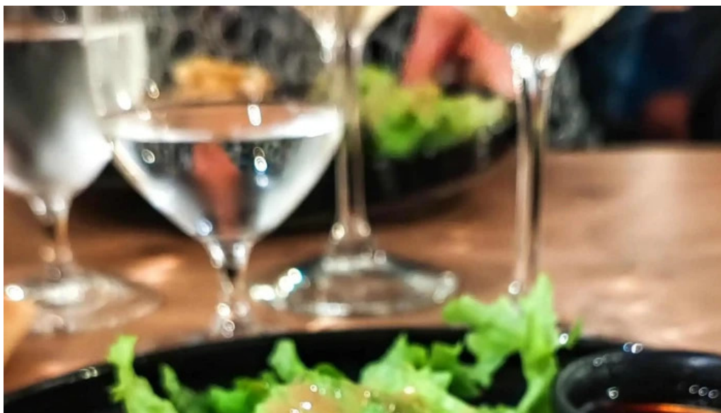
Vins paradoxe restaurant a niort adresse