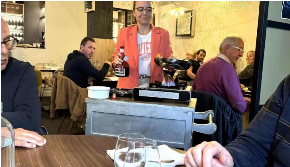
Vins paradoxe restaurant a niort atmosphere