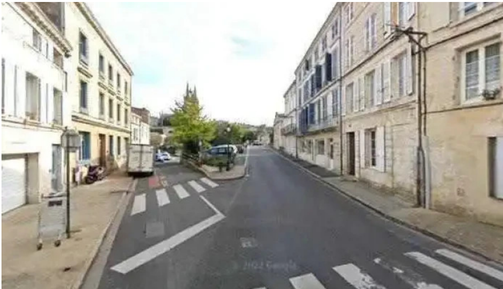
Vins paradoxe restaurant a niort street view et 360deg