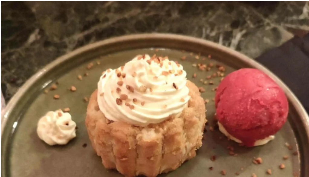
Larrosair ouvert maintenant