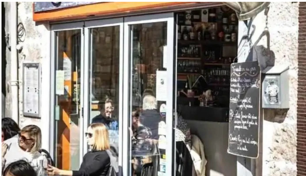
L arrosoir niort