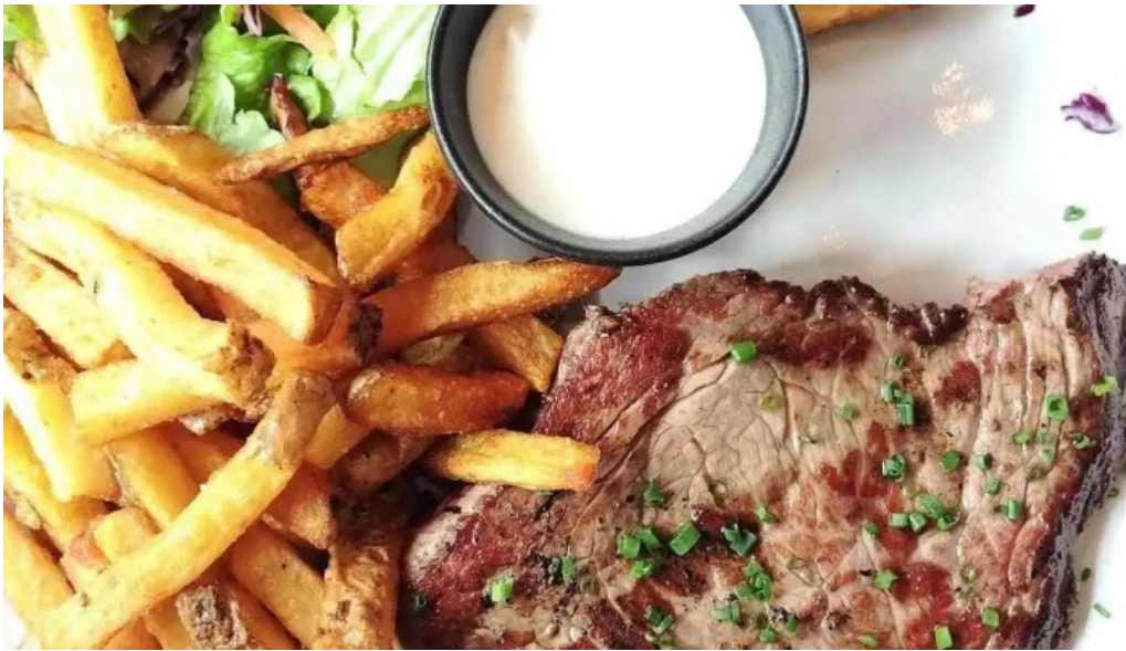
Larrosoir les plus recentes