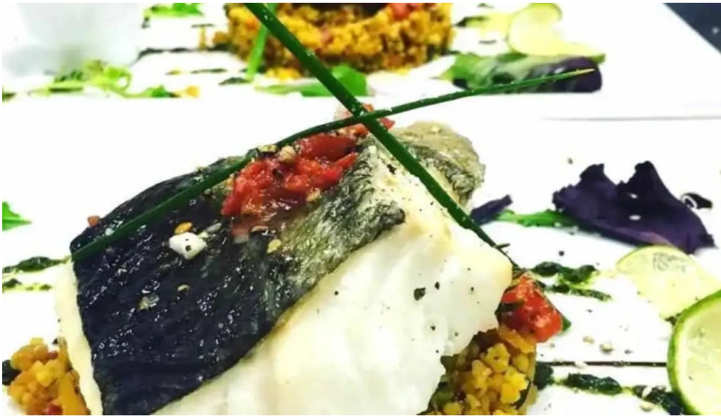
Larrosair plats et boissons