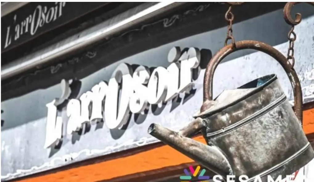
Larrosair photos du propriétaire