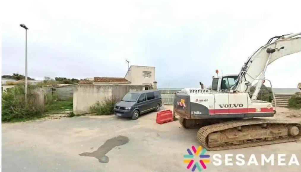
Experience company angoulins