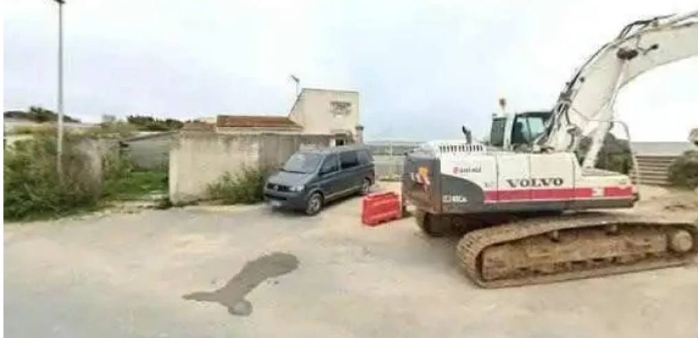
Experience company tout