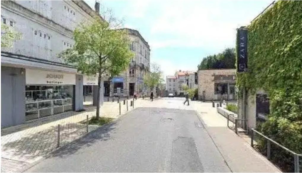
La bistronomie angouleme street view et 360deg