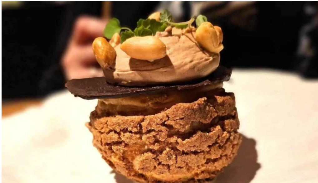
La bistronomie angouleme ou