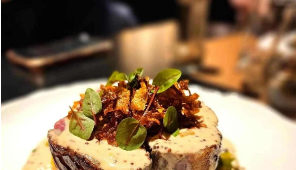
La bistronomie angouleme angouleme