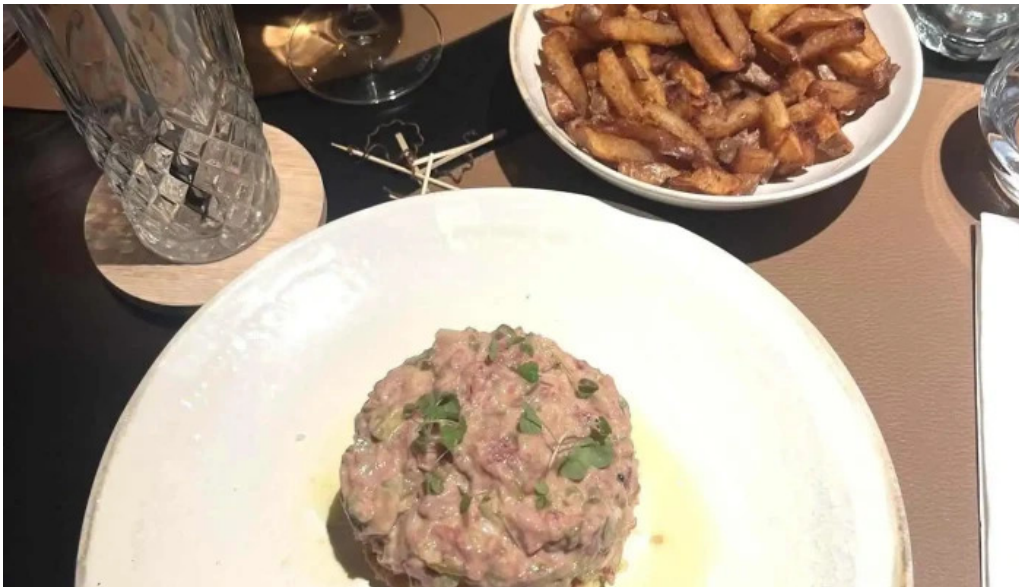
La bistronomie angouleme steak tartare