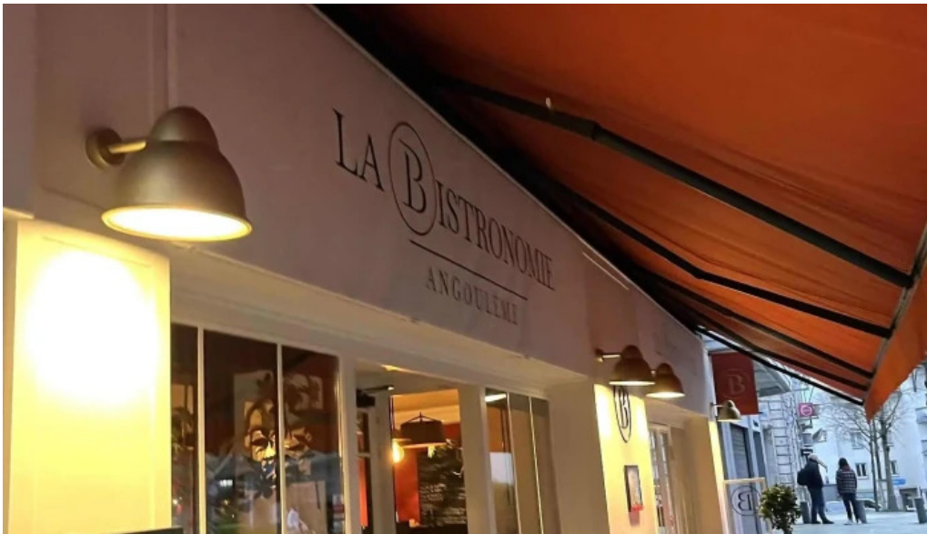
La bistronomie angouleme prix