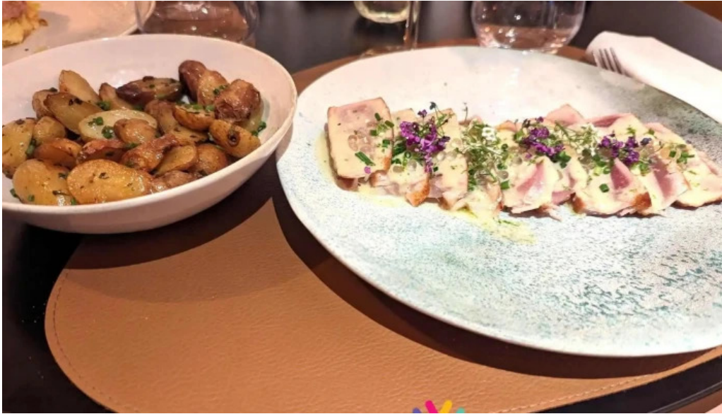
La bistronomie angouleme squash