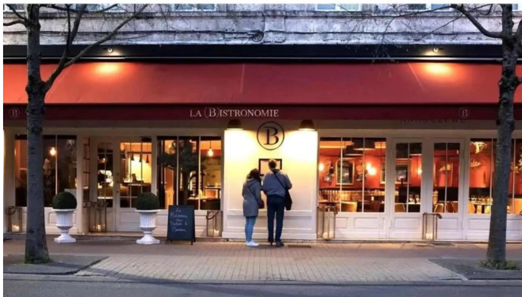
La bistronomie angouleme tout