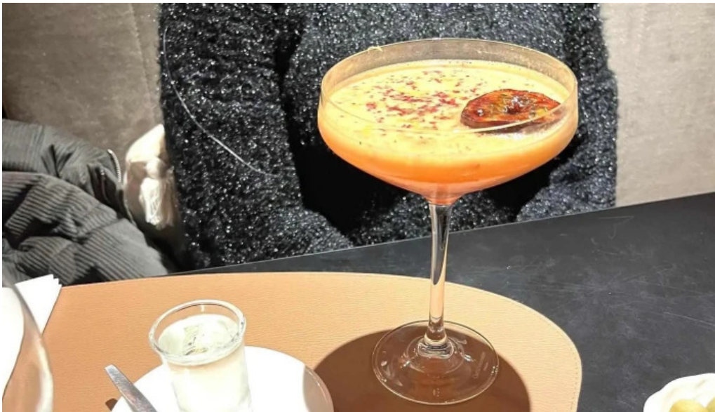
La bistronomie angouleme reductions