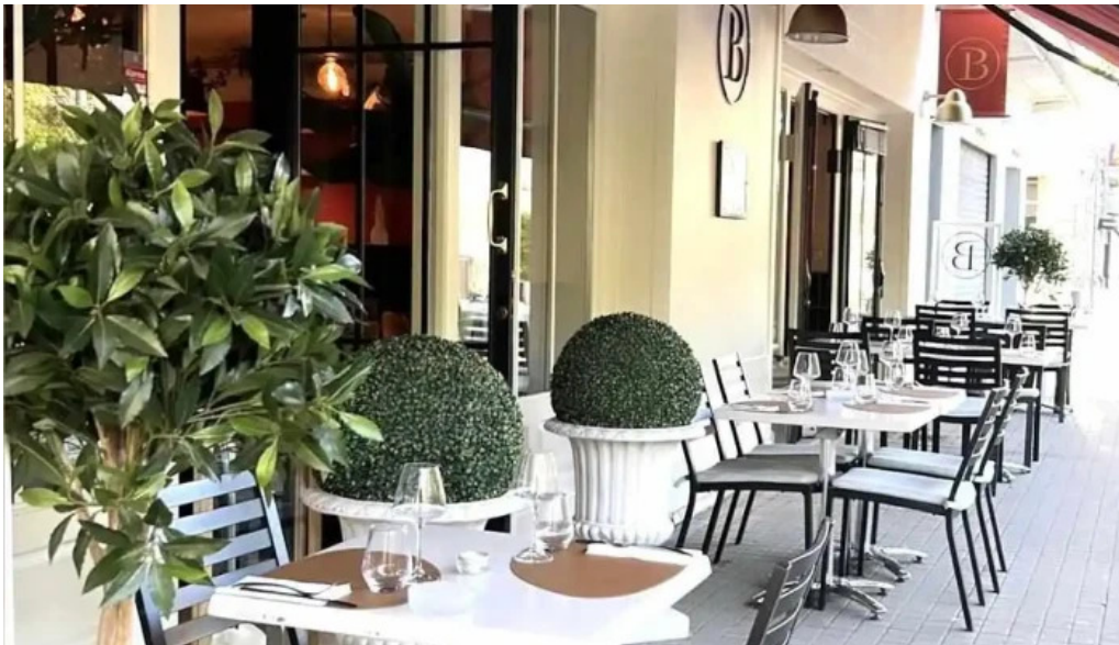
La bistronomie angouleme atmosphere