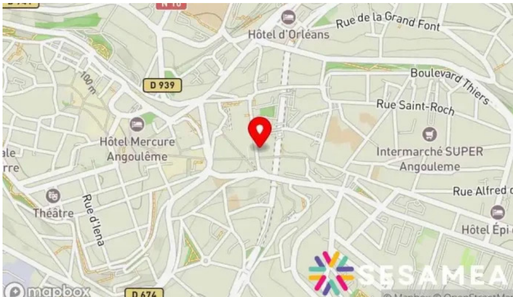
La bistronomie angouleme carte