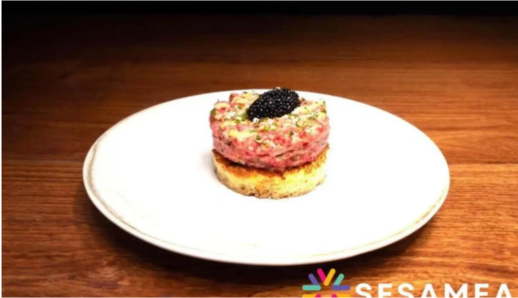
La bistronomie angouleme plats et boissons