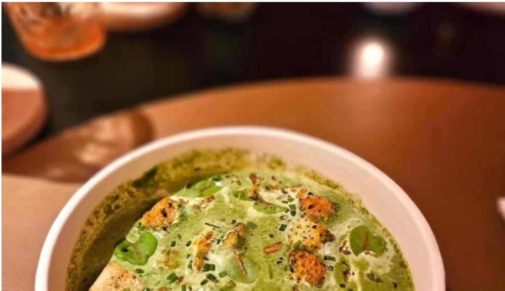
La bistronomie angouleme restaurant