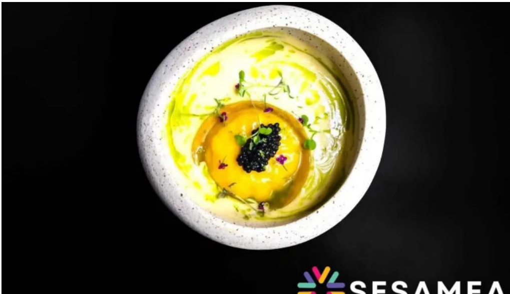
La bistronomie angouleme