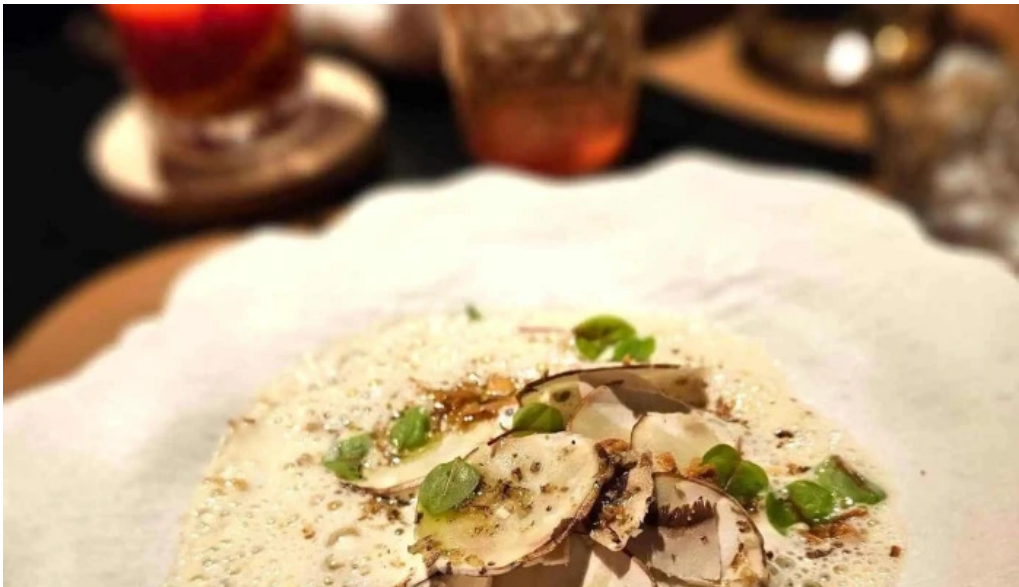
La bistronomie angouleme adresse