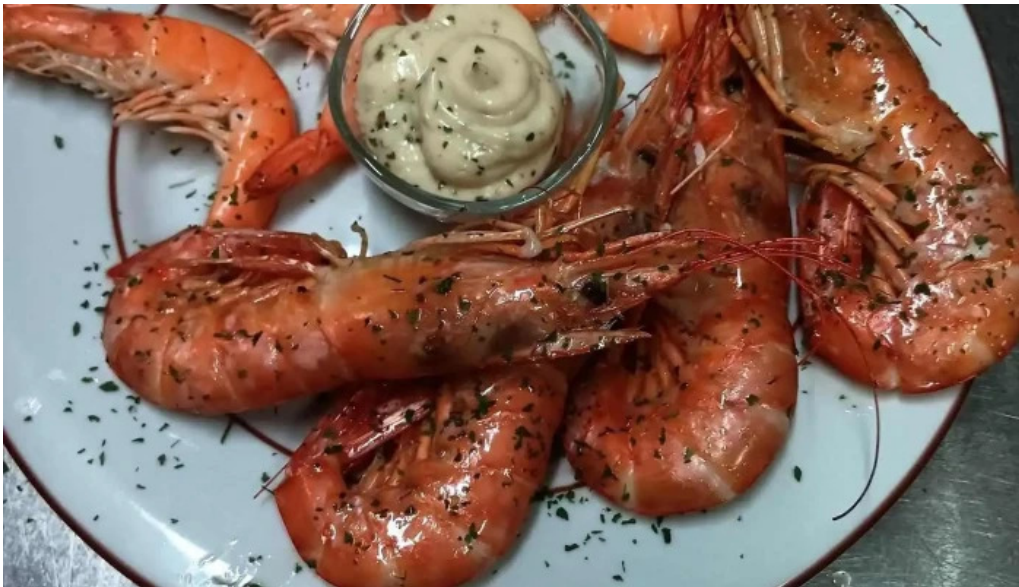
Terre et mer plats et boissons