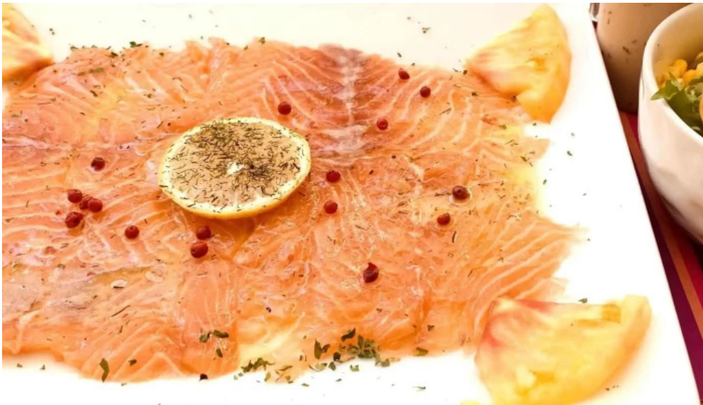
Terre et mer photos