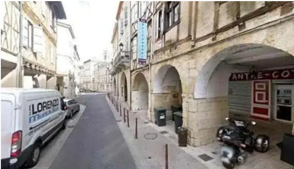
Terre et mer street view et 360deg