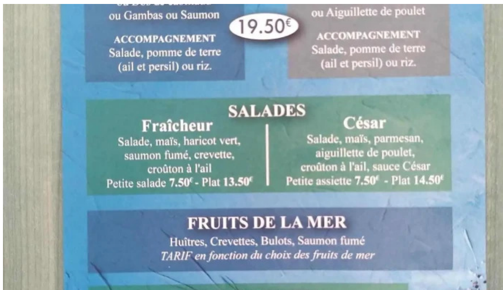
Terre et mer menu