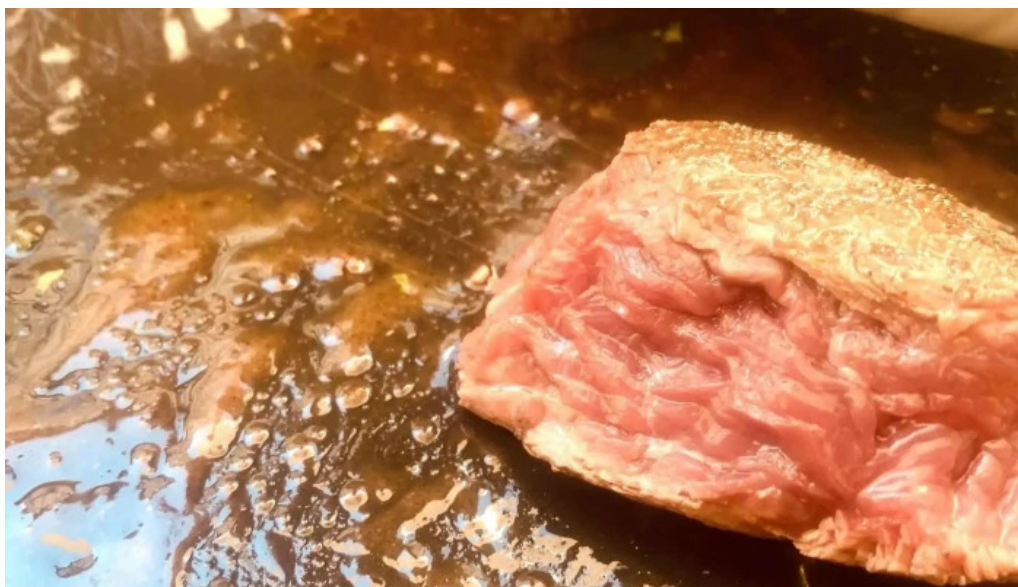
Terre et mer agen