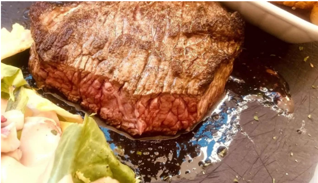
Terre et mer numero