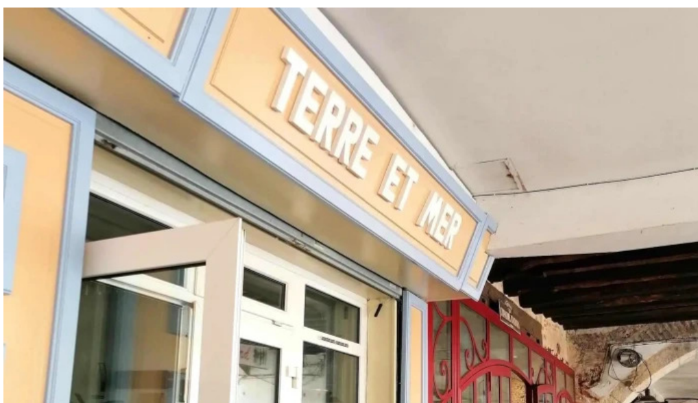
Terre et mer adresse