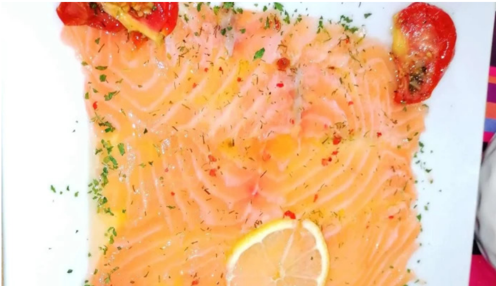
Terre et mer site web