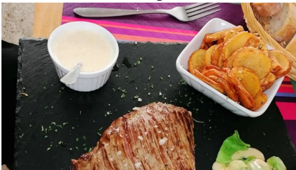
Terre et mer zone