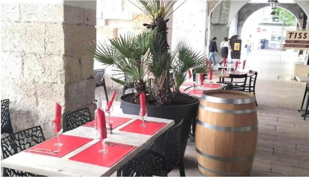
Terre et mer tout