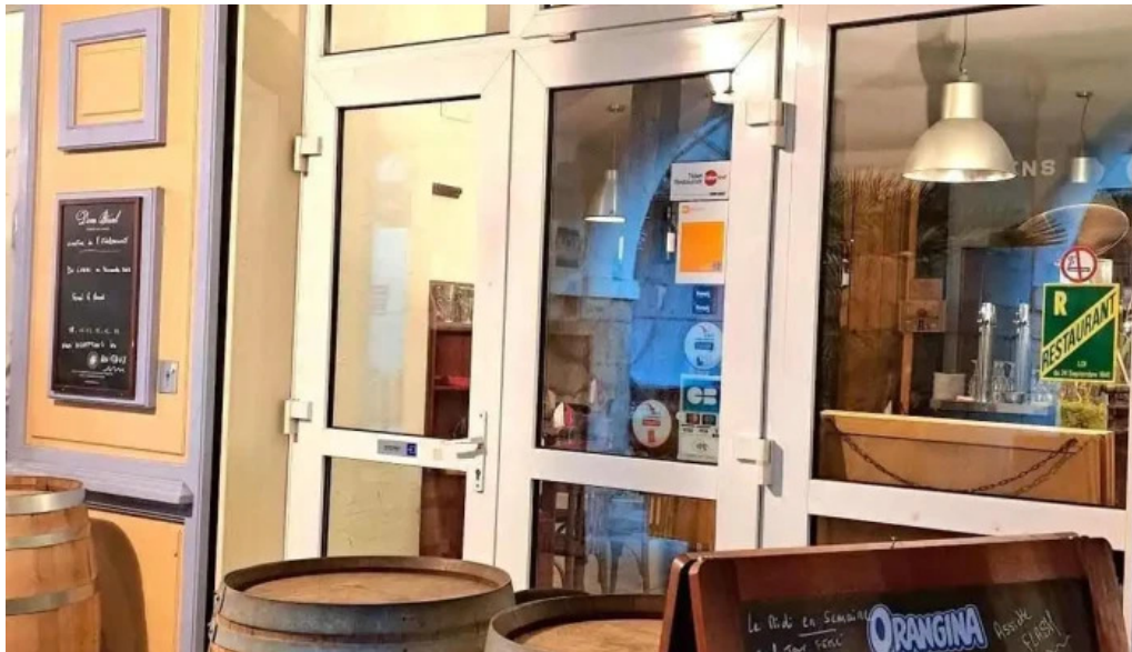
Terre et mer les plus recentes