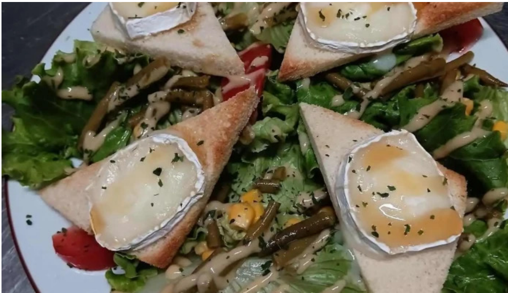
Terre et mer photos du propriétaire