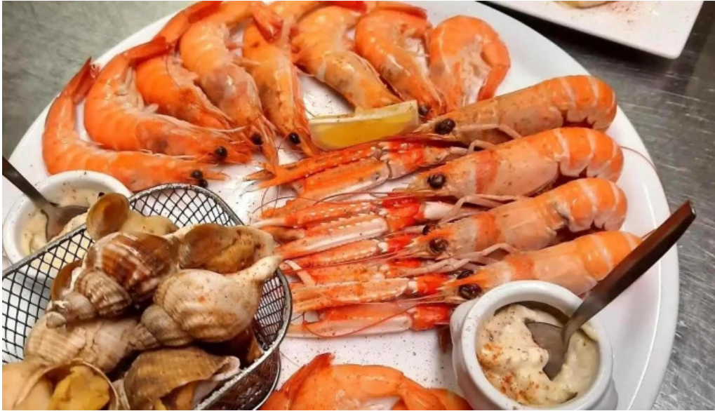
Terre et mer produits de la mer