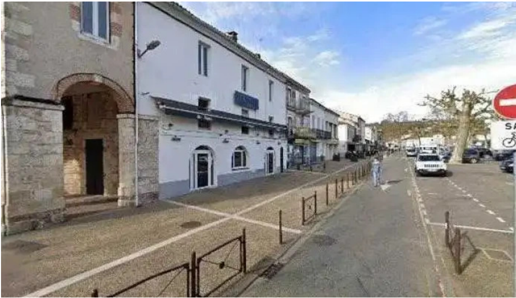
Le vinivore street view et 360deg