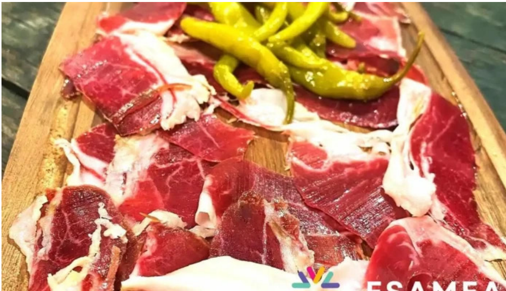
Le vinivore plats et boissons