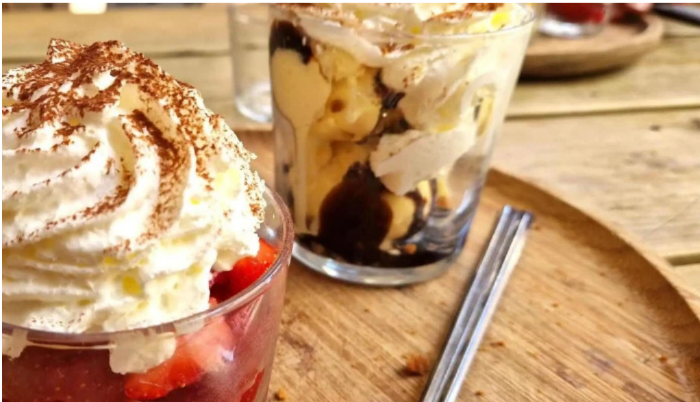
Le vinivore restaurant