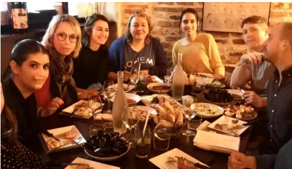
Le vinivore site web