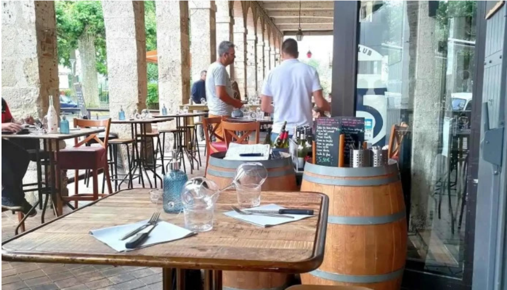
Le vinivore atmosphere