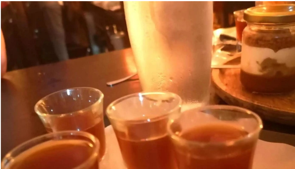
Le vinivore ouvert maintenant