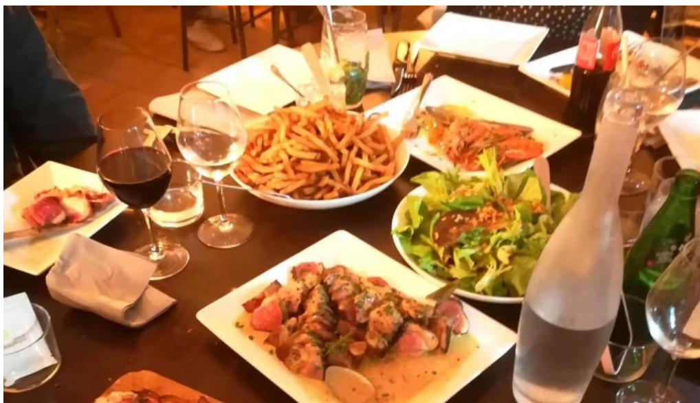
Le vinivore adresse