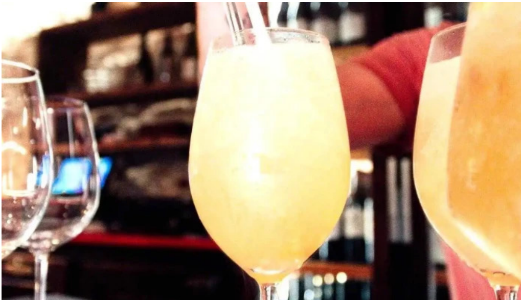
Le vinivore photos du propriétaire