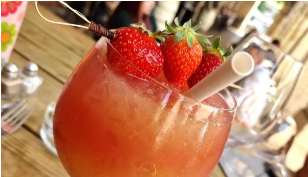
Le vinivore score