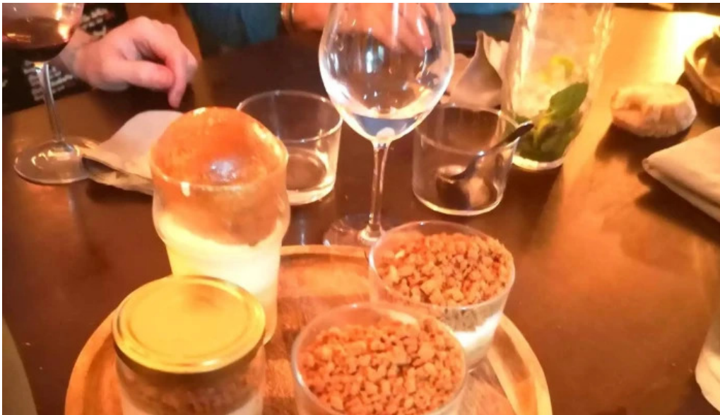
Le vinivore emplacement