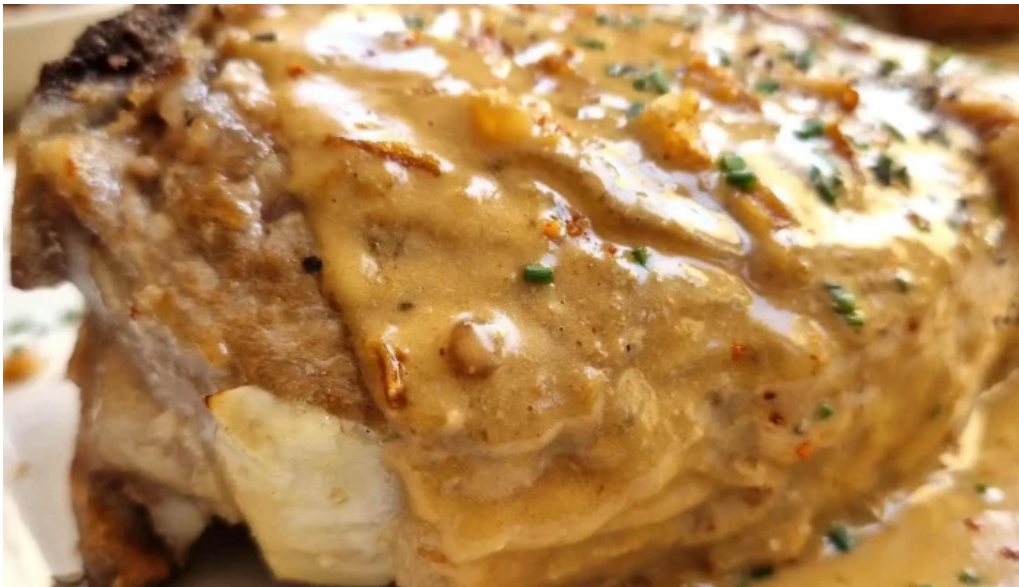
Le vinivore agen