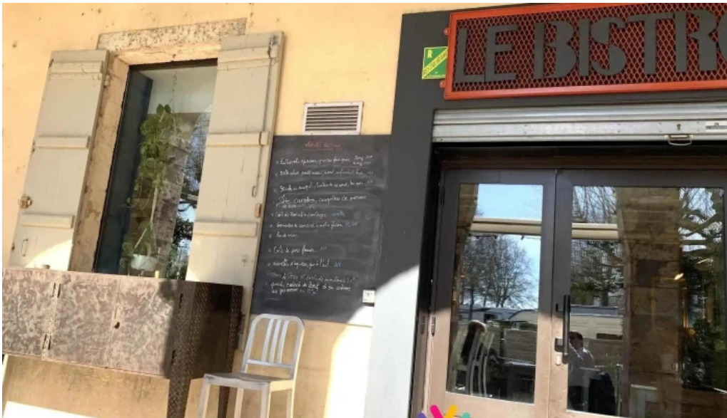
Le bistrone menu