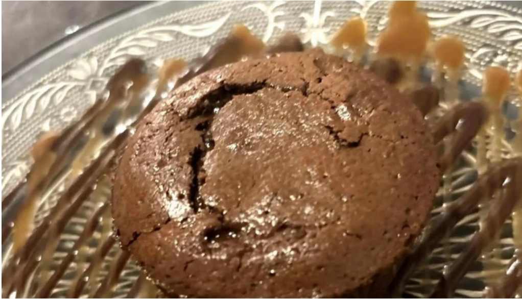
Le bistronome videos