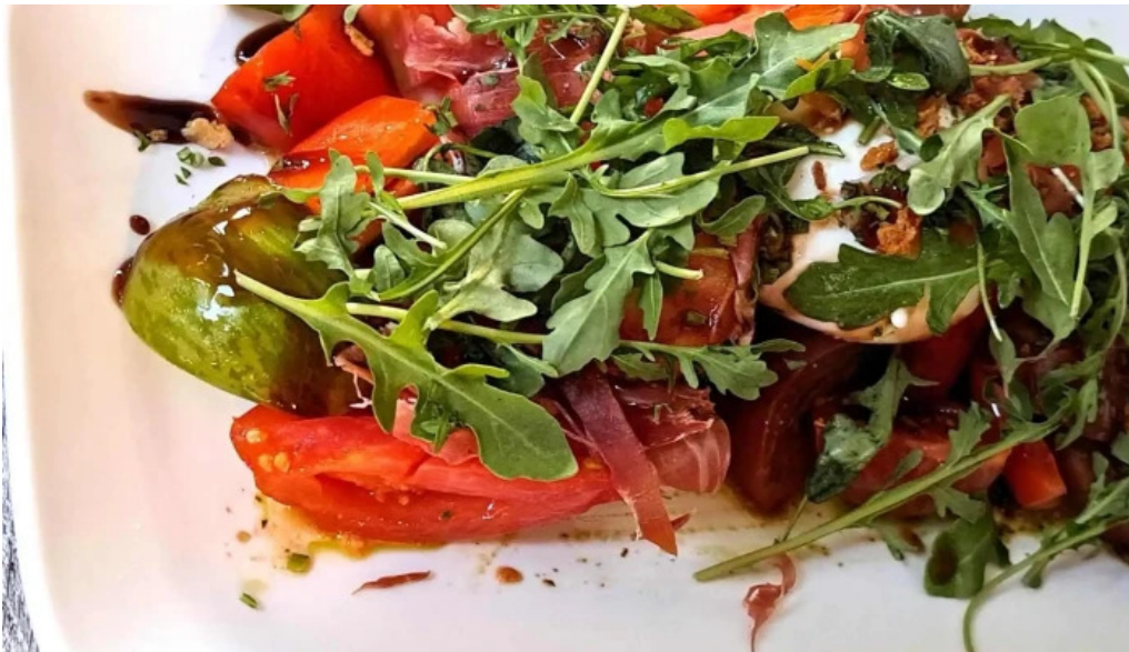
Le bistronome agen