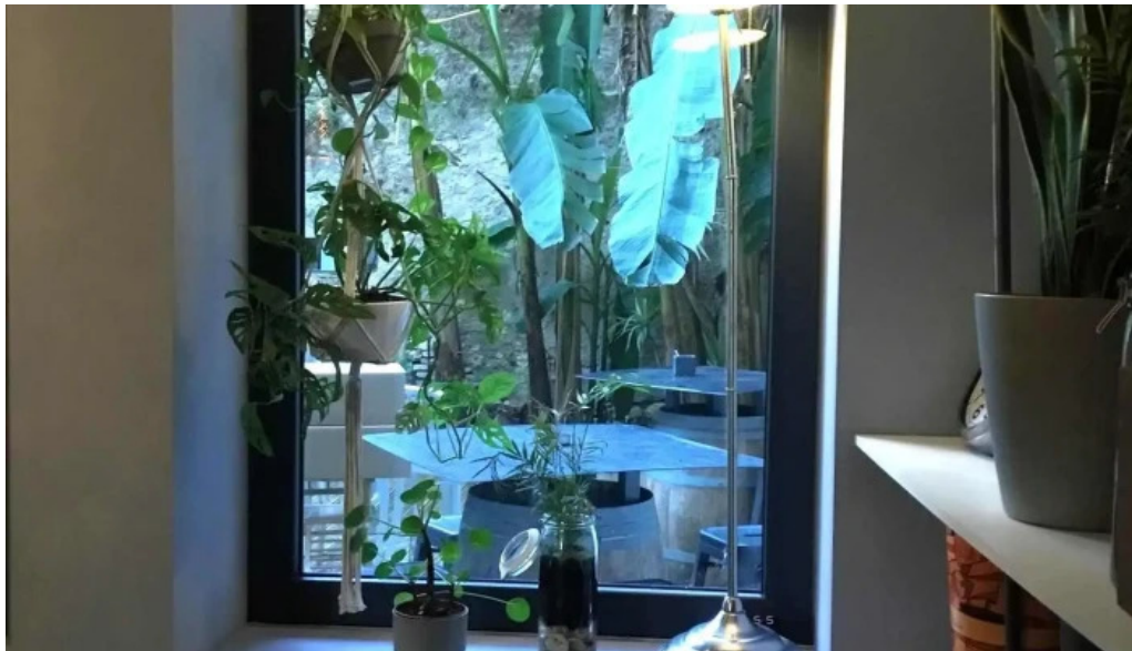
Le bistronome