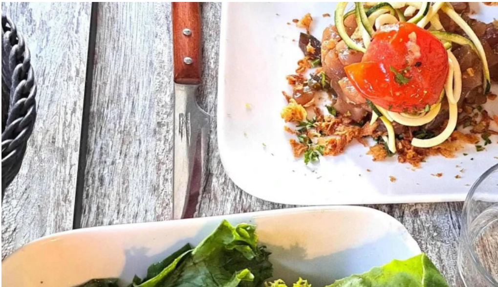
Le bistronome telephone