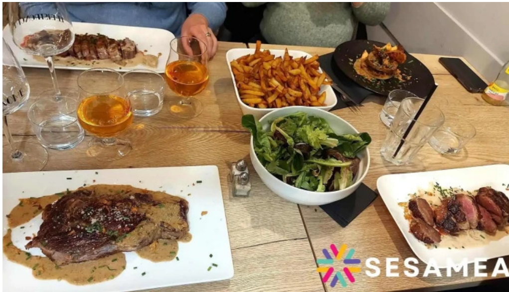
Le bistronome plats et boissons