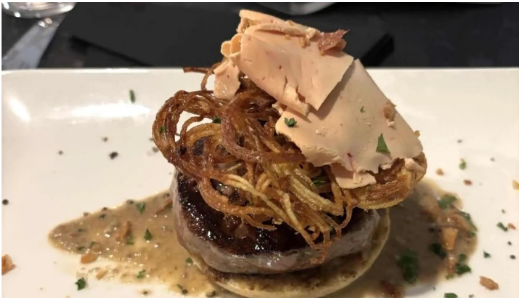
Le bistronome reductions