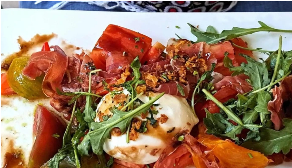
Le bistronome site web