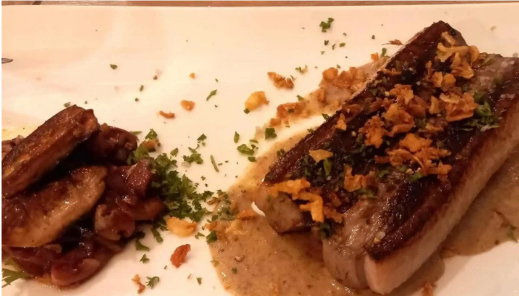
Le bistronome restaurant