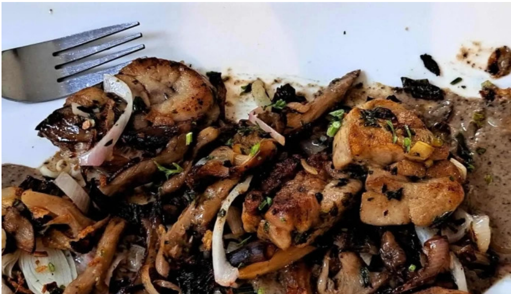
Le bistrone horaire