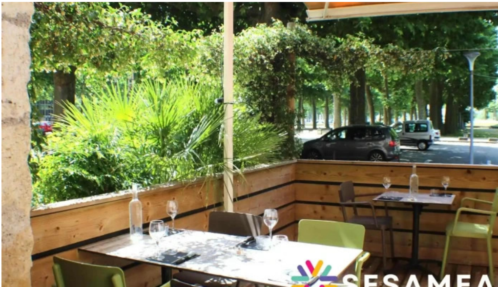
Le bistrone atmosphere