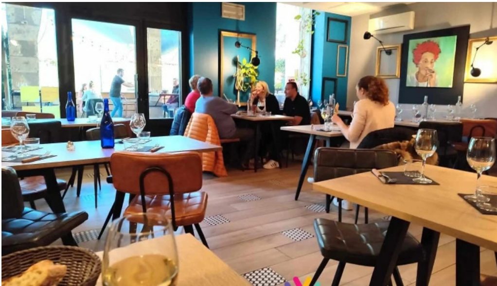
Le bistronome tout