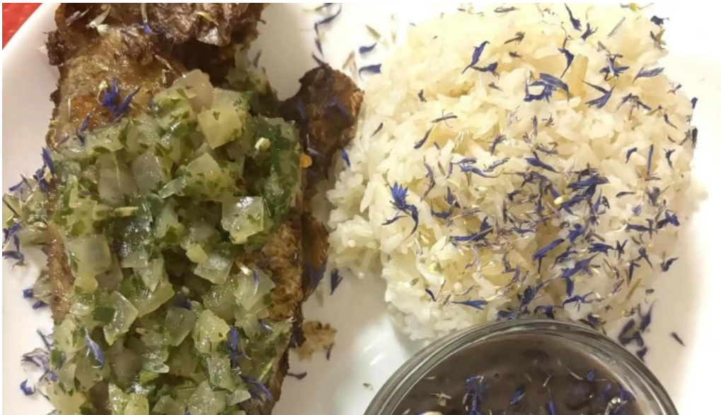
La mine des saveurs restaurant antillais numero