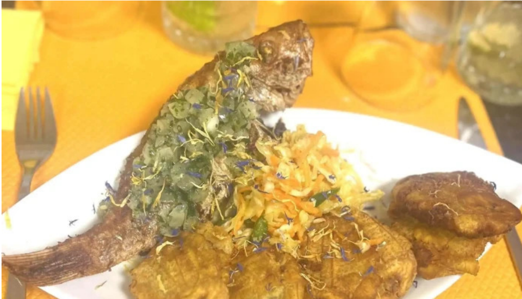
La mine des saveurs restaurant antillais commentaires