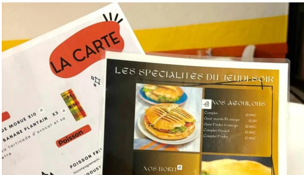
La mine des saveurs restaurant antillais instagram