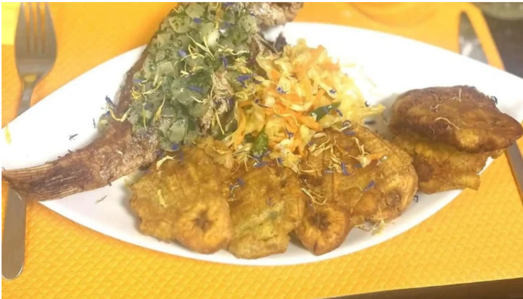
La mine des saveurs restaurant antillais plats et boissons