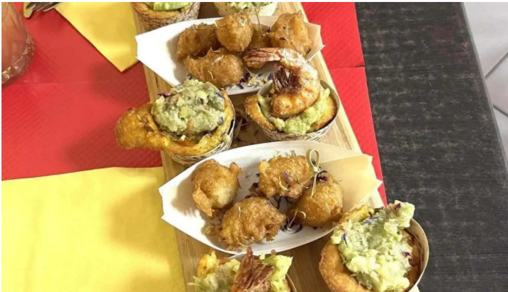
La mine des saveurs restaurant antillais tout