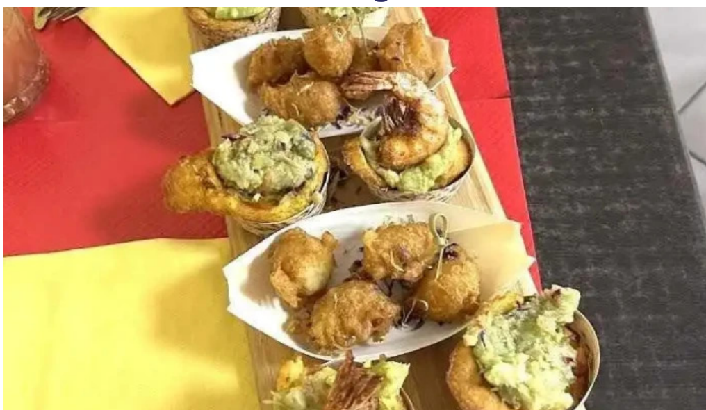
La mine des saveurs restaurant antillais agen