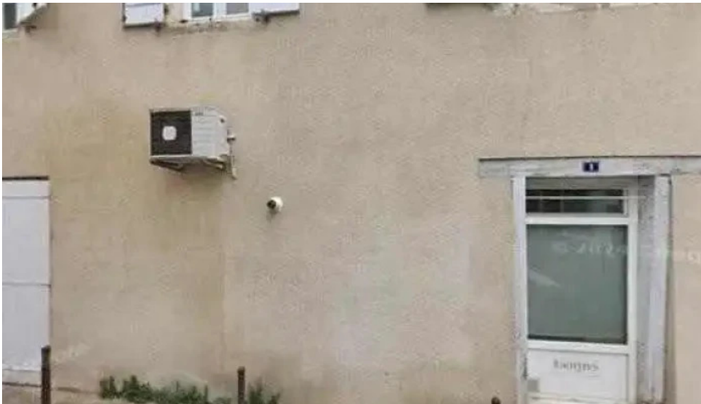
La mine des saveurs restaurant antillais street view et 360deg