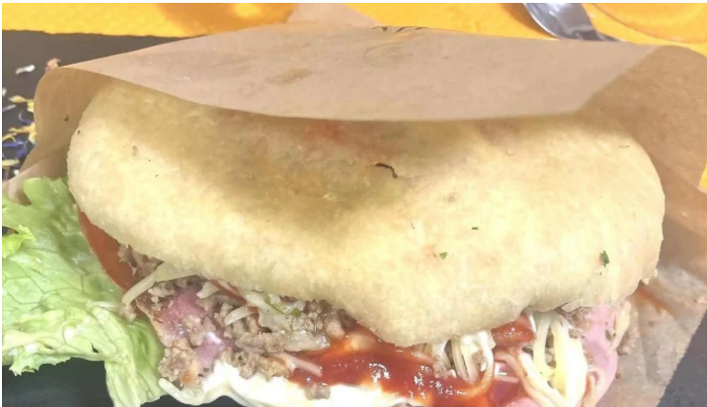
La mine des saveurs restaurant antillais comment arriver