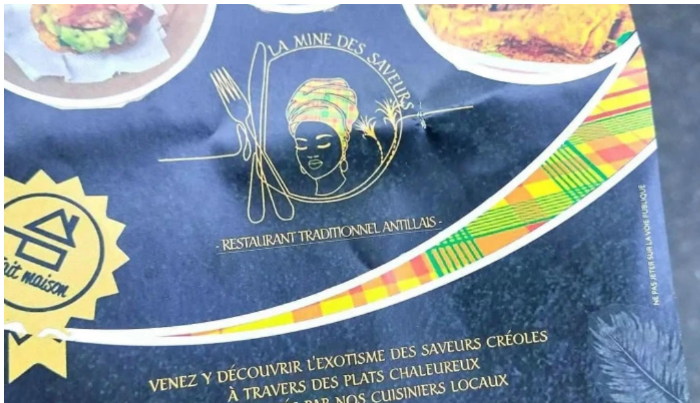
La mine des saveurs restaurant antillais menu