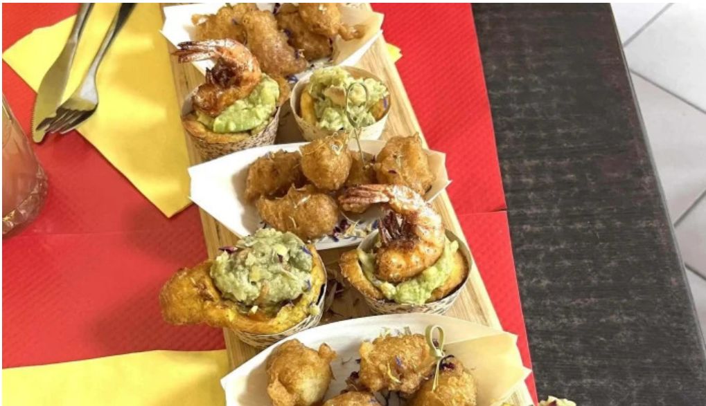
La mine des saveurs restaurant antillais ou