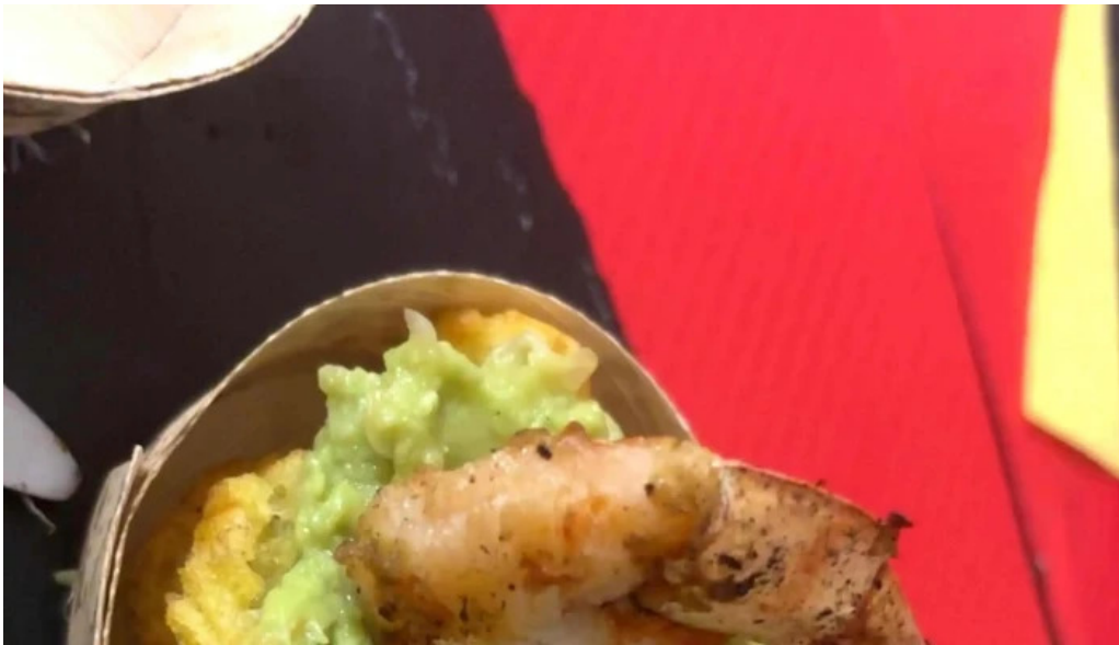
La mine des saveurs restaurant antillais agen