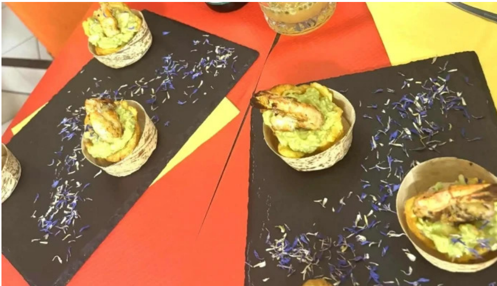
La mine des saveurs restaurant antillais restaurant