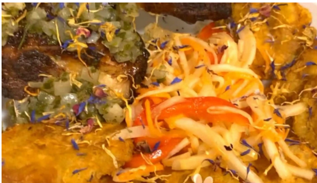
La mine des saveurs restaurant antillais adresse