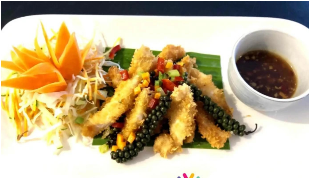
Restaurant madame anh photos du proprietaire