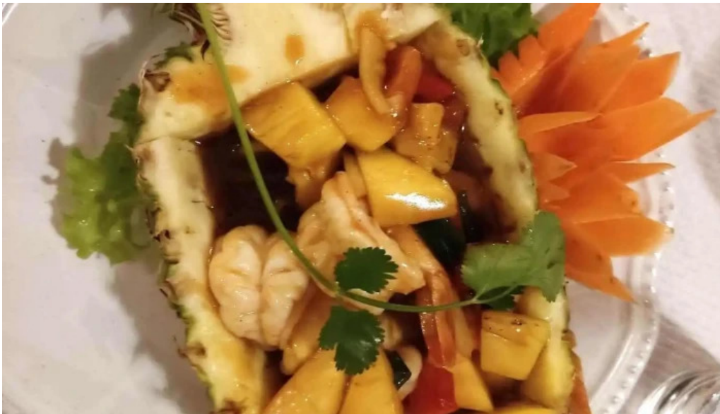
Restaurant madame anh les plus recentes