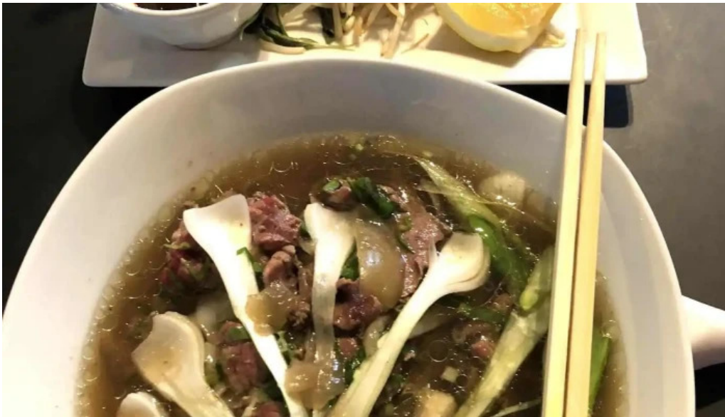
Restaurant madame anh plats et boissons