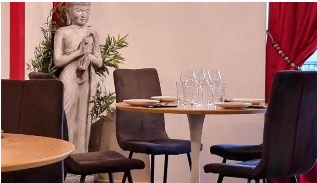
Restaurant madame anh tout