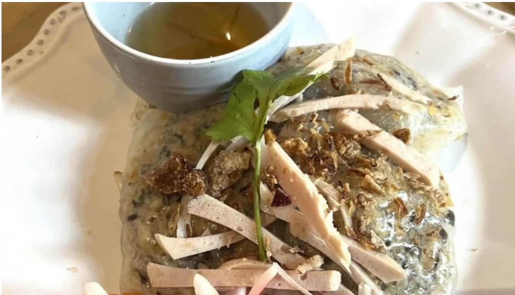
Restaurant madame anh commentaires