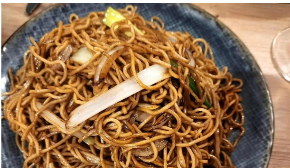
Restaurant madame anh agen