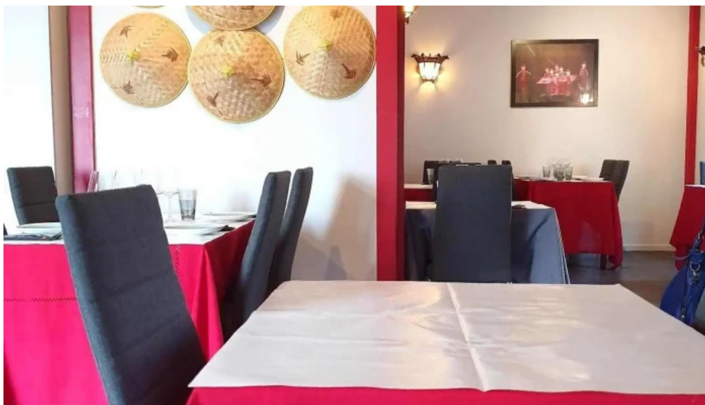
Restaurant madame anh atmosphere