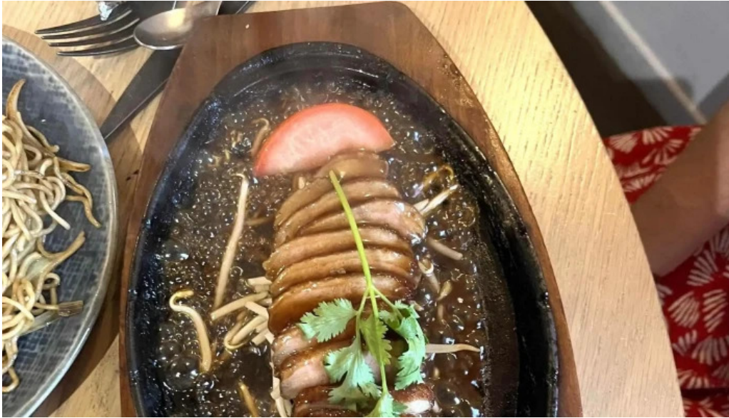
Restaurant madame anh horaire