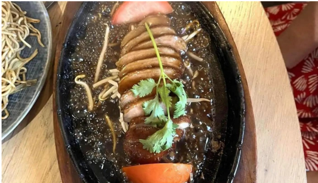
Restaurant madame anh nouille