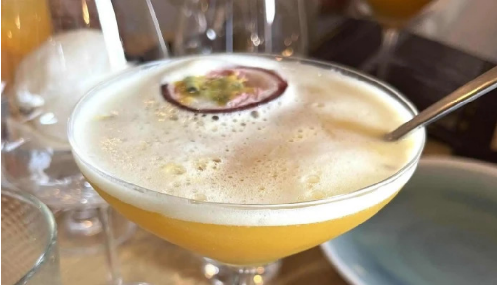
Restaurant madame anh comment arriver