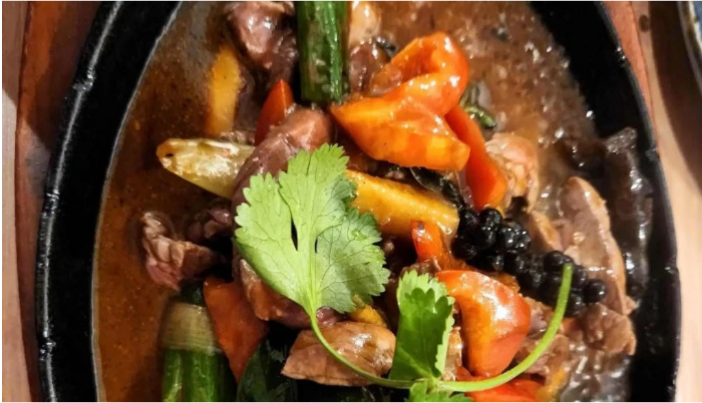
Restaurant madame anh restaurant vietnamien