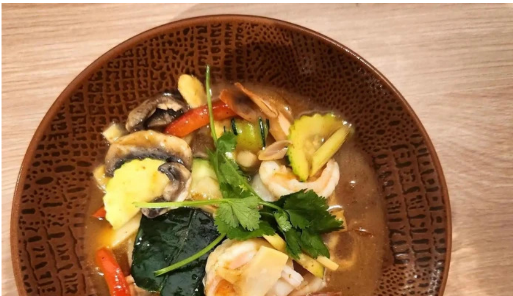
Restaurant madame anh instagram