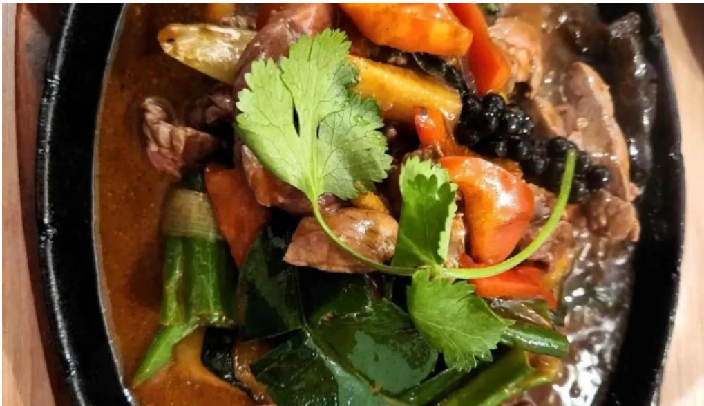
Restaurant madame anh soupe