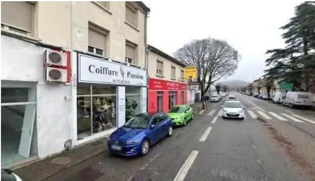
Restaurant madame anh street view et 360deg