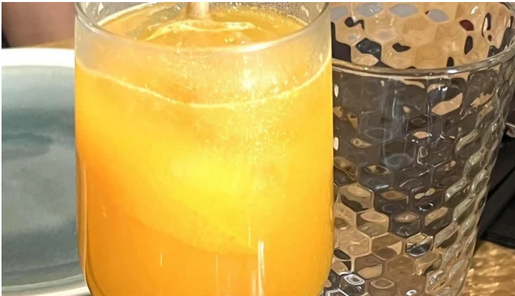
Restaurant madame anh reductions