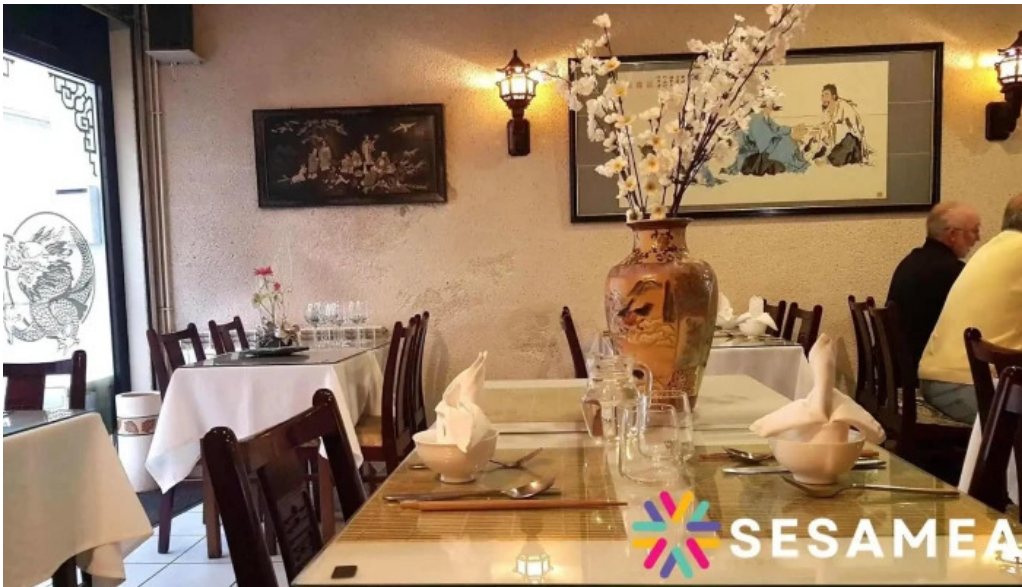
Le vietnam tout