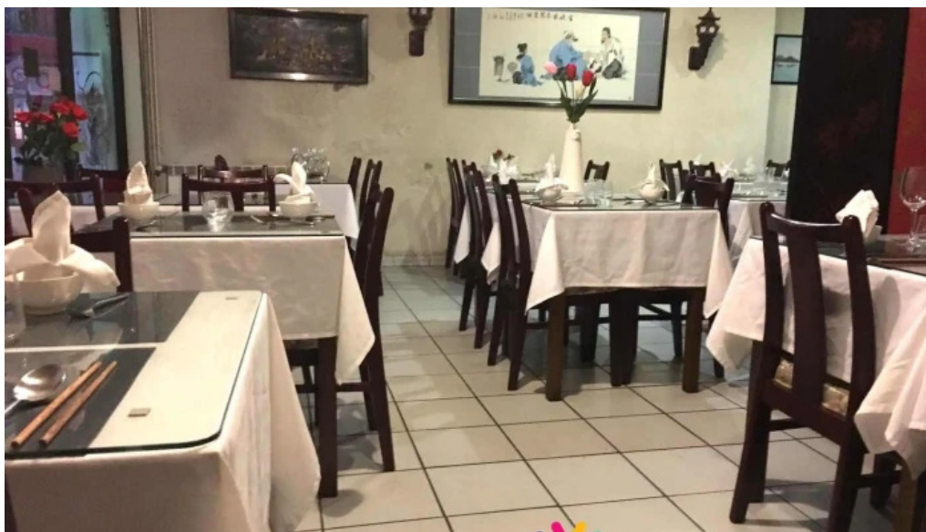
Le vietnam atmosphere