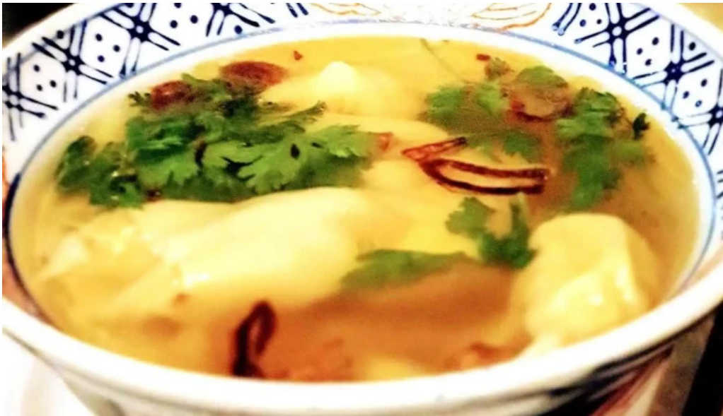
Le vietnam soupe