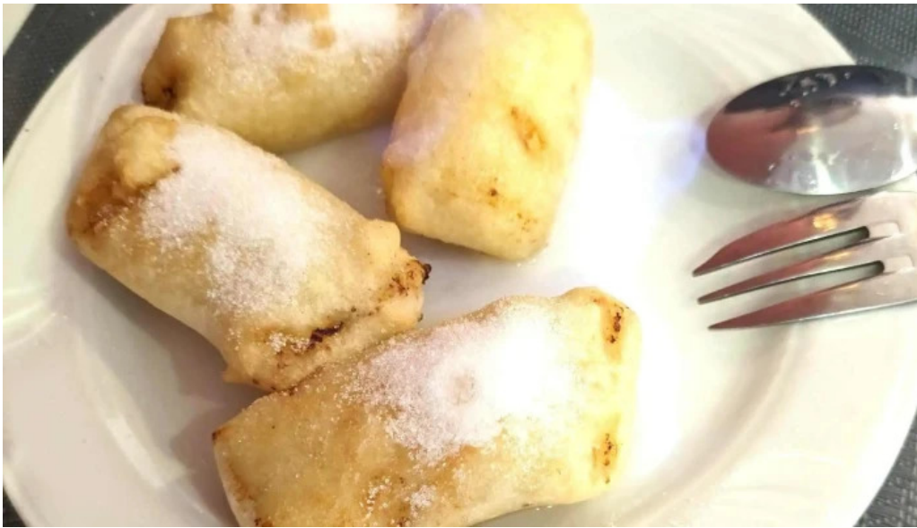
Le vietnam videos