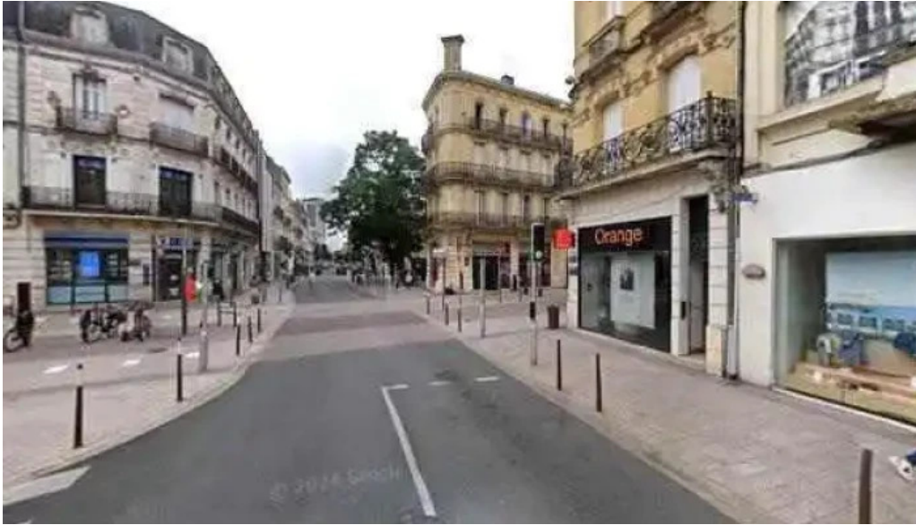
Le vietnam street view et 360deg