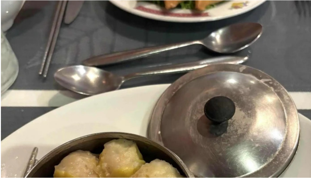
Le vietnam restaurant vietnamien