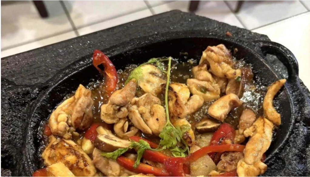
Le vietnam ou