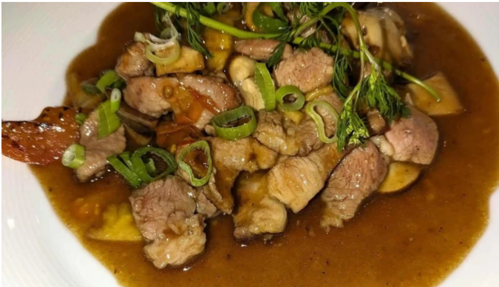
Le vietnam horaire