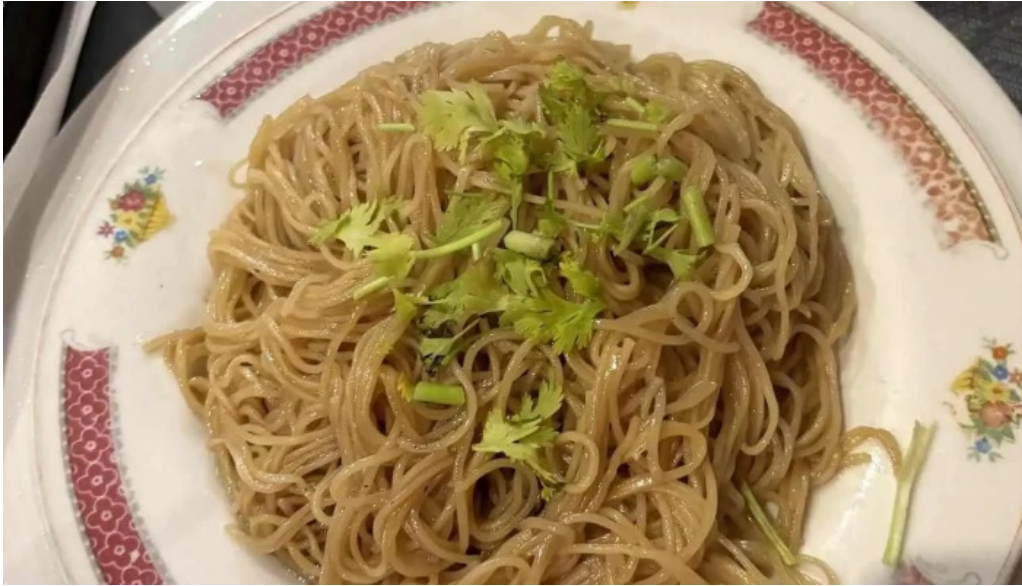
Le vietnam nouille