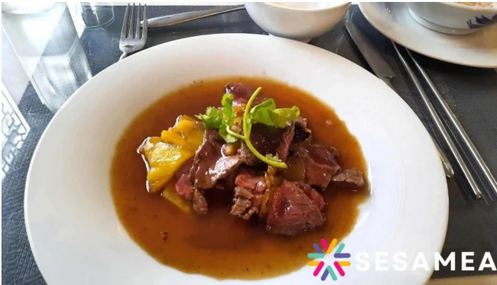
Le vietnam plats et boissons