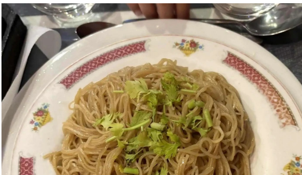
Le vietnam agen