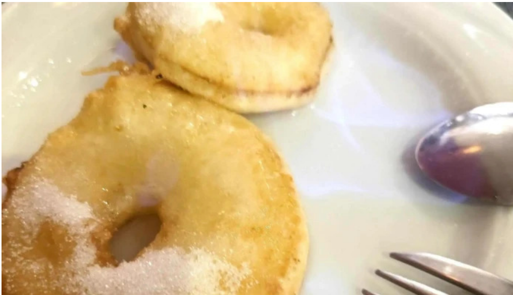
Le vietnam catalogue