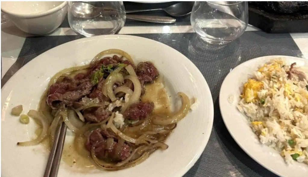
Le vietnam numero