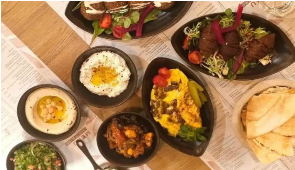
Lassiette du liban les plus recentes