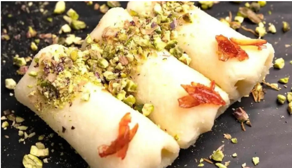
Lassiette du liban plats et boissons