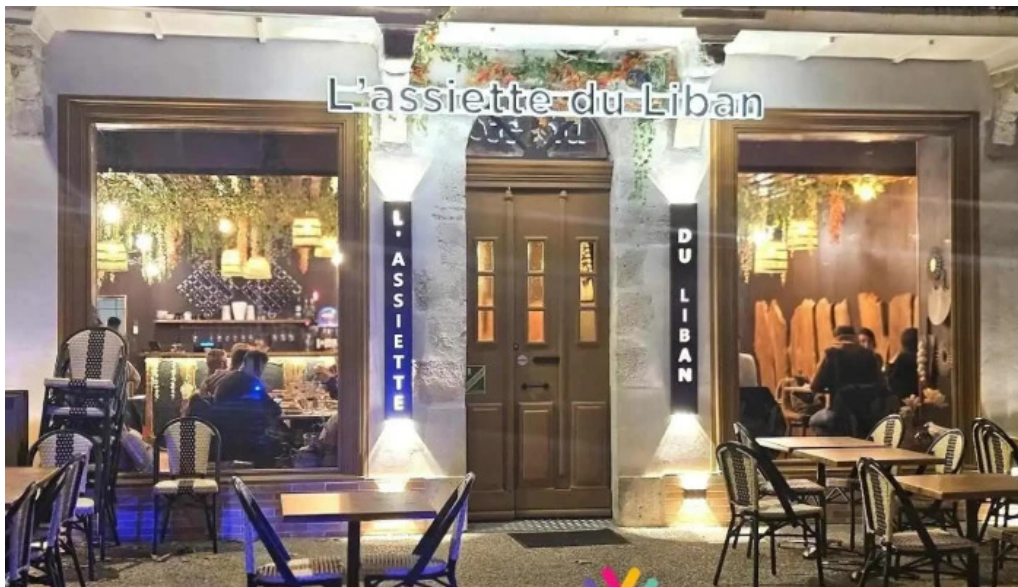
L assiette du liban agen