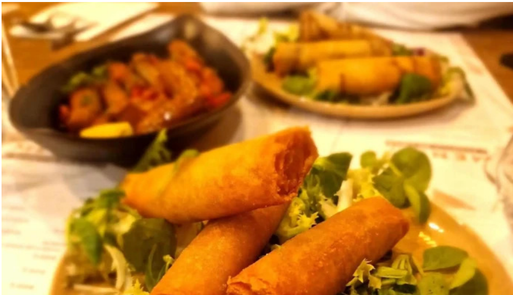
Lassiette du liban agen