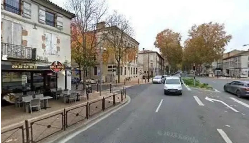
Lassiette du liban street view et 360deg