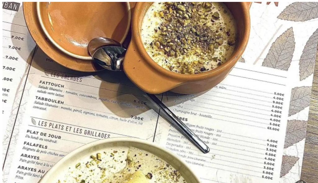
Lassiette du liban adresse