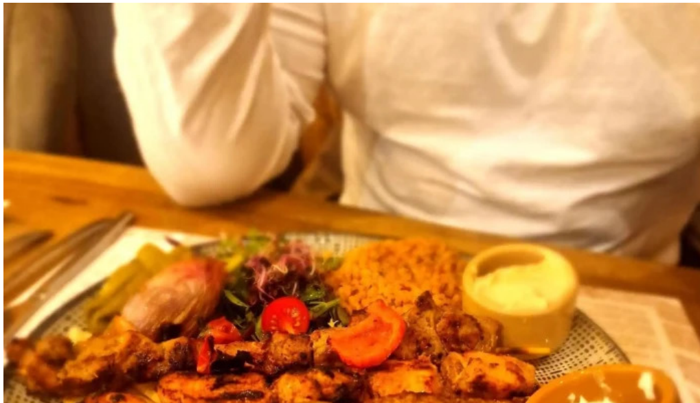
Lassiette du liban telephone