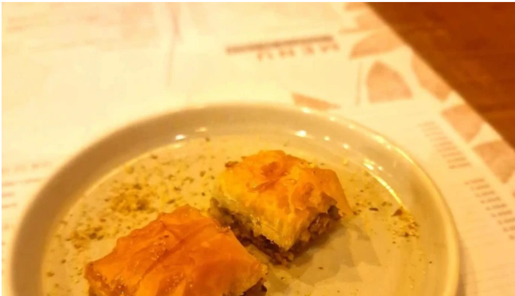
Lassiette du liban promotion