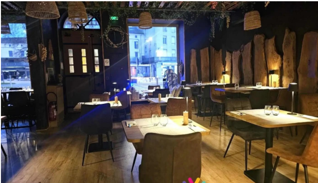
Lassiette du liban atmosphere