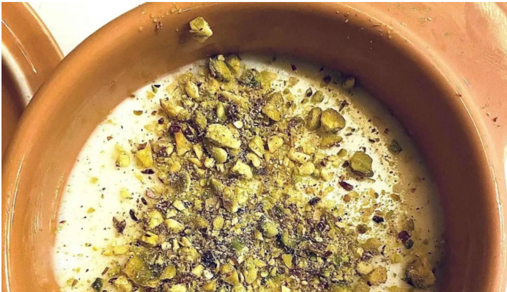
Lassiette du liban emplacement