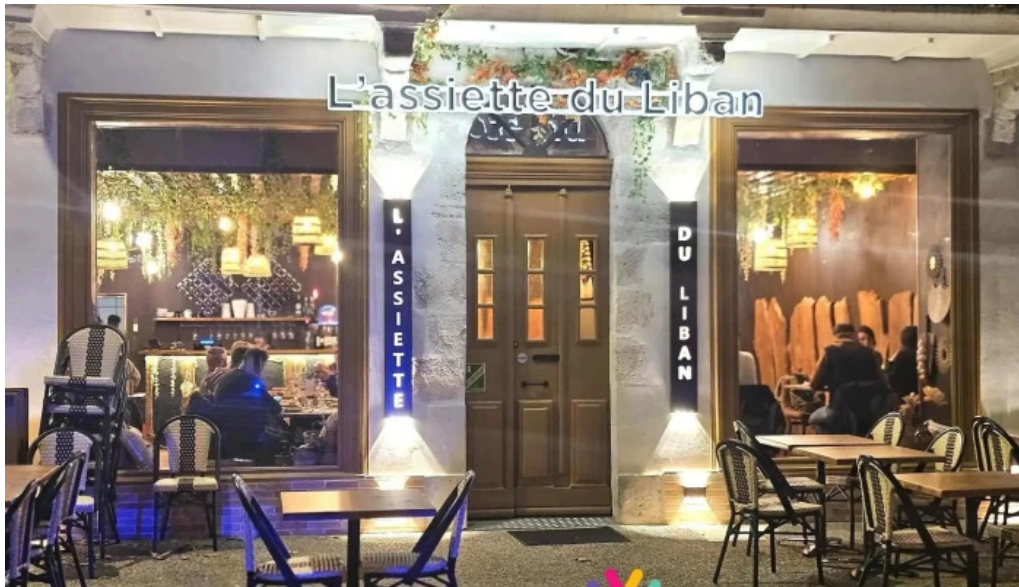
Lassiette du liban tout