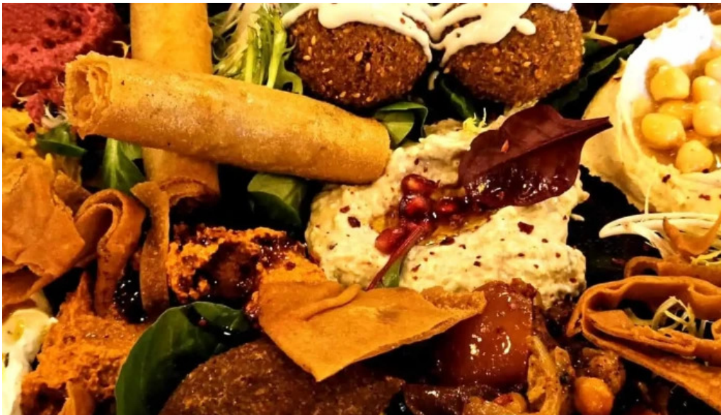
Lassiette du liban restaurant libanais