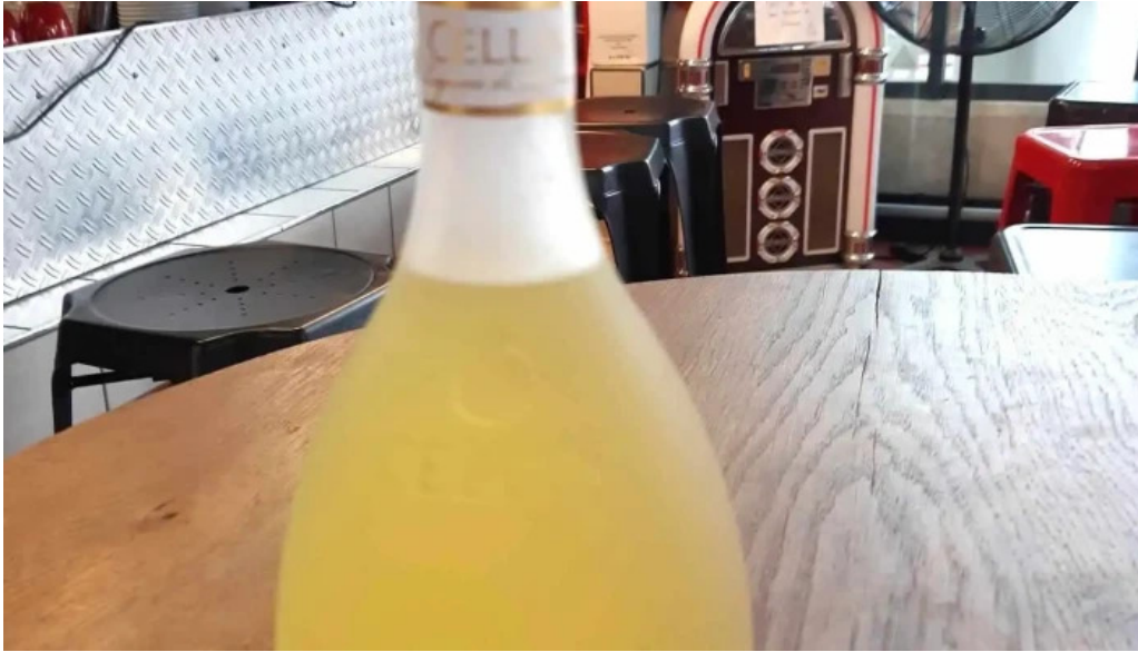
Casa italia plats et boissons