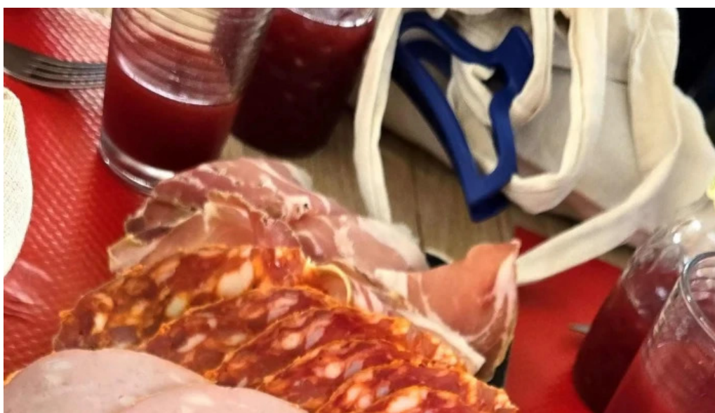
Casa italia angouleme