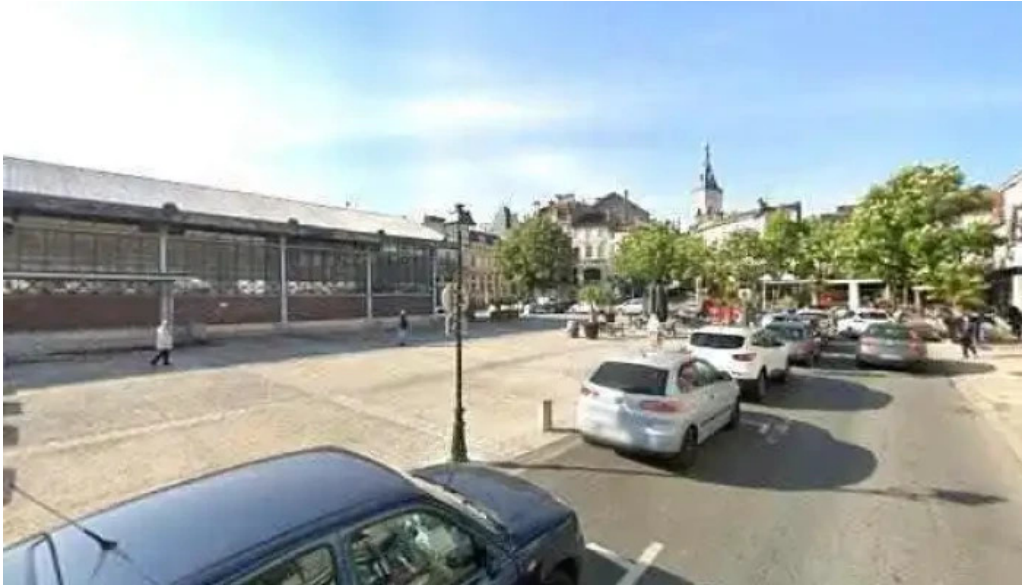
Casa italia street view et 360deg