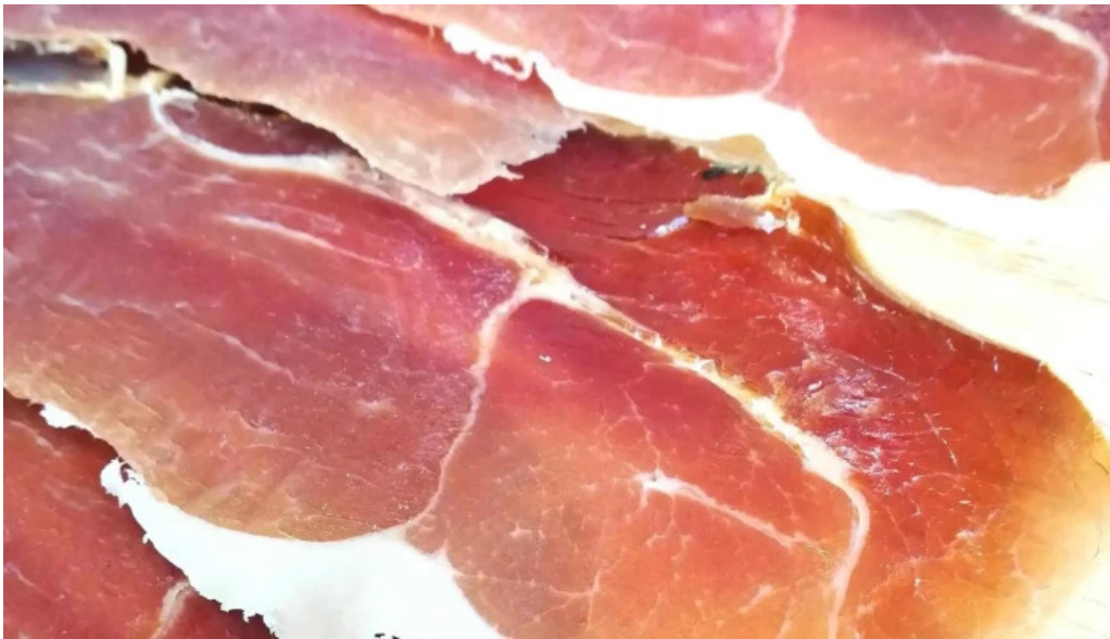
Casa italia site web