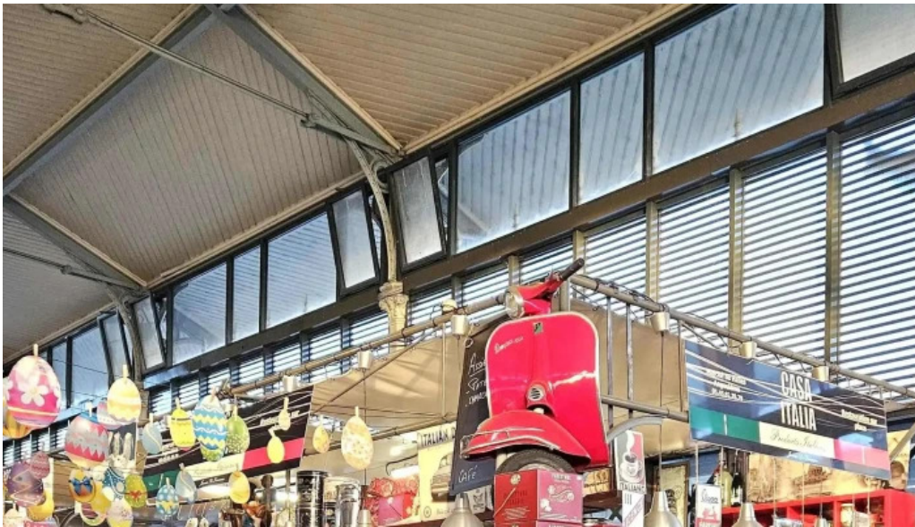
Casa italia opinions