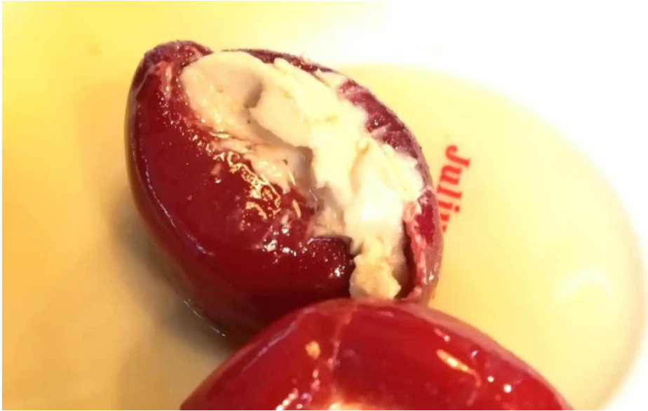
Casa italia score