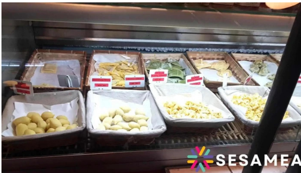
Casa italia atmosphere