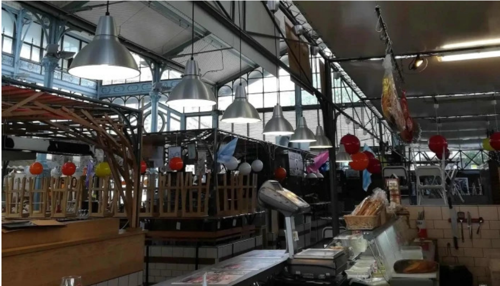
Casa italia comment arriver