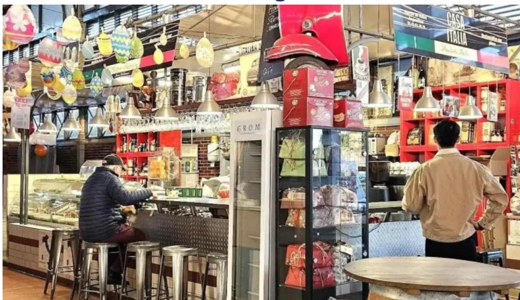
Casa italia tout