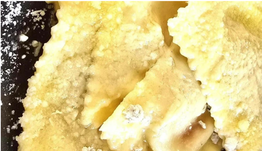
Casa italia restaurant italien