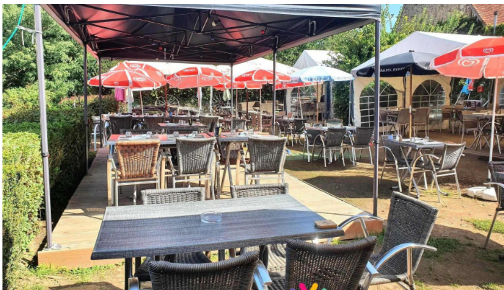
Auberge des pecheurs atmosphere