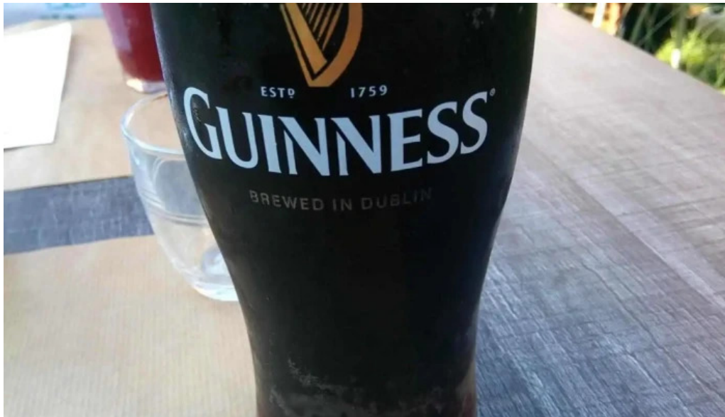
Auberge des pecheurs guinness