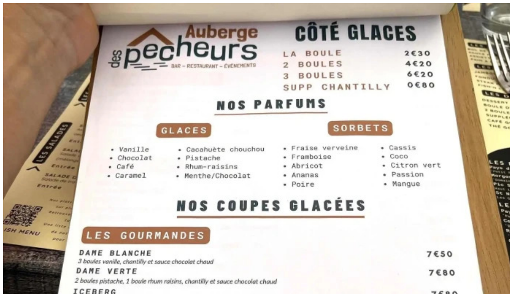
Auberge des pêcheurs emplacement