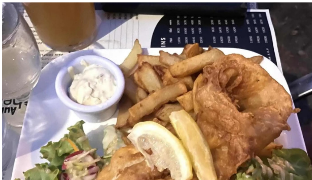
Auberge des pecheurs la celle dunoise