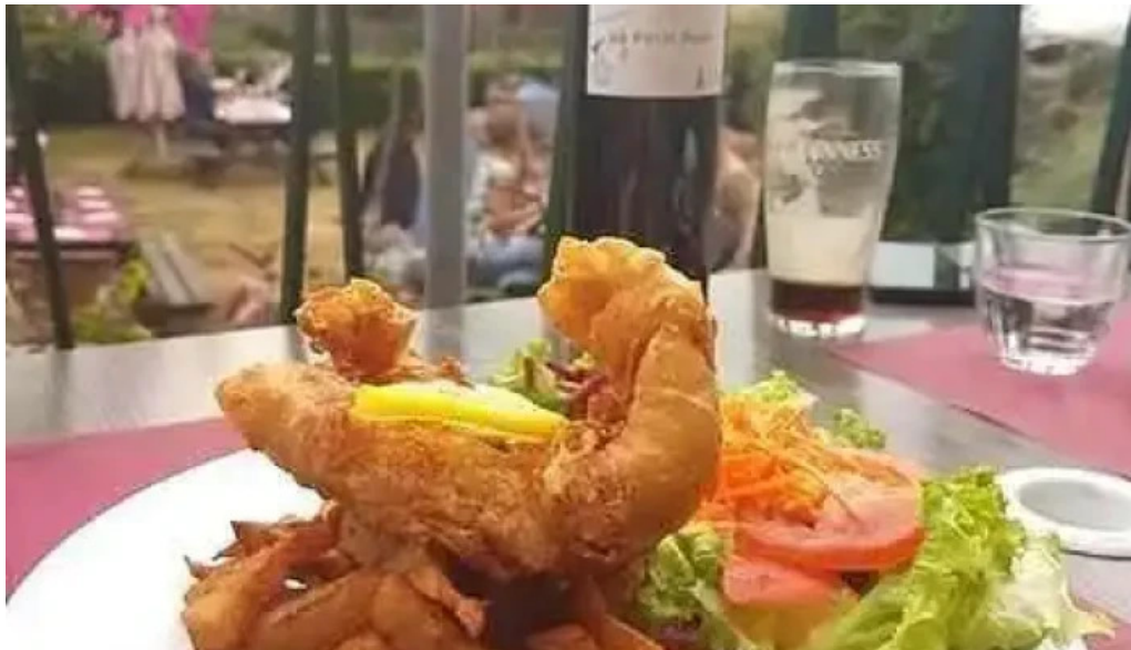
Auberge des pecheurs fish and chips