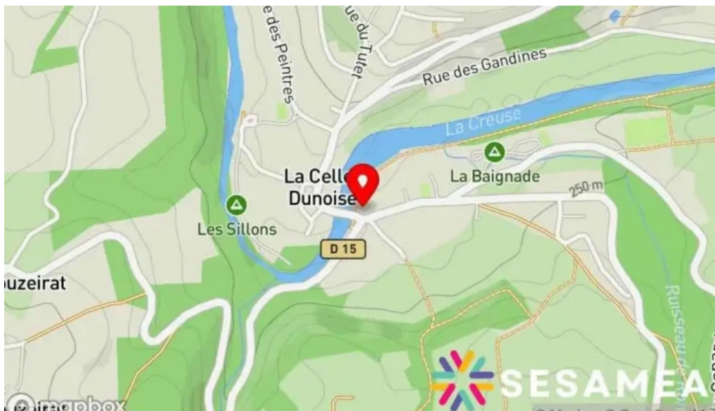
Auberge des pecheurs carte