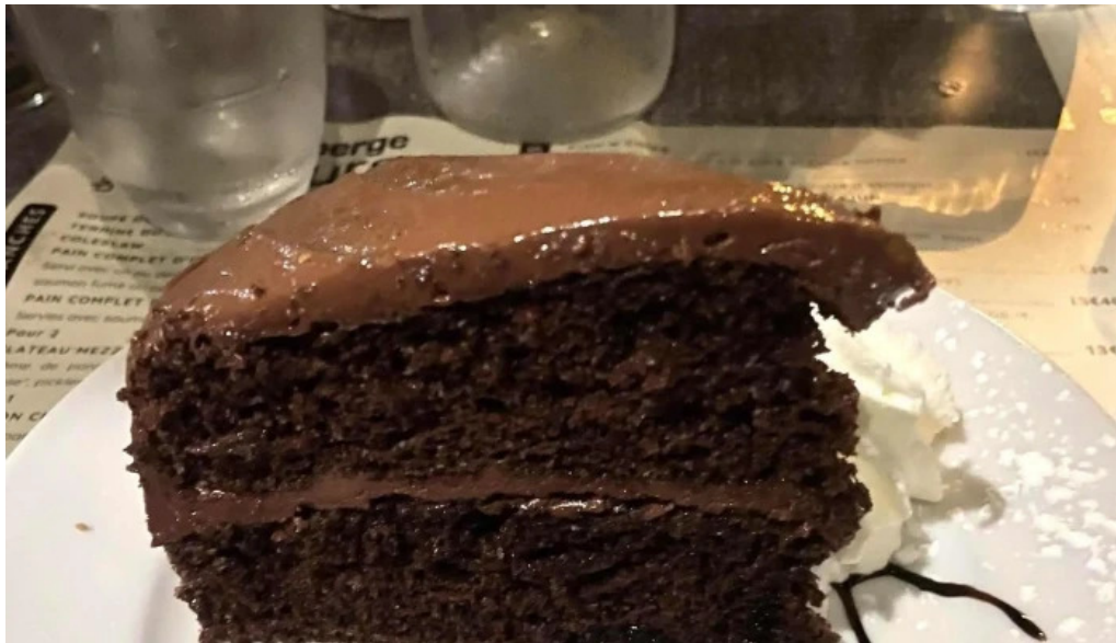
Auberge des pecheurs promotion