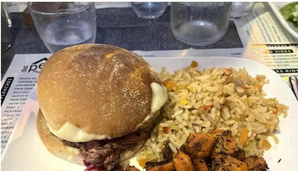
Auberge des pecheurs restaurant irlandais