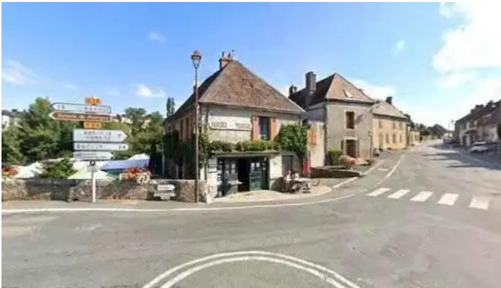
Auberge des pecheurs street view et 360deg