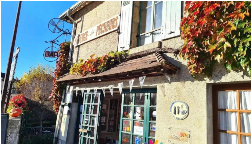
Auberge des pêcheurs tout