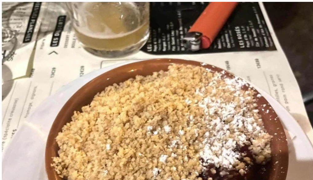
Auberge des pêcheurs comment arriver