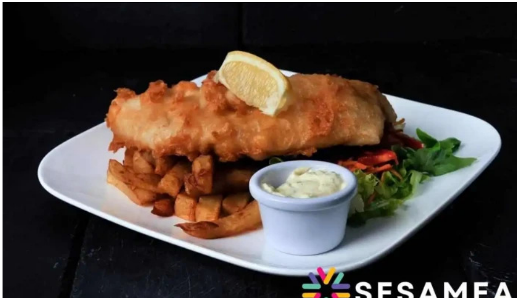
Auberge des pecheurs plats et boissons