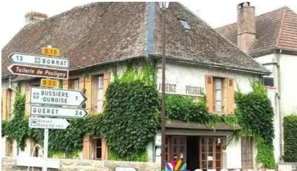
Auberge des pecheurs