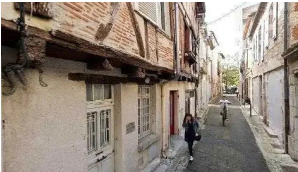
Arome street view et 360deg