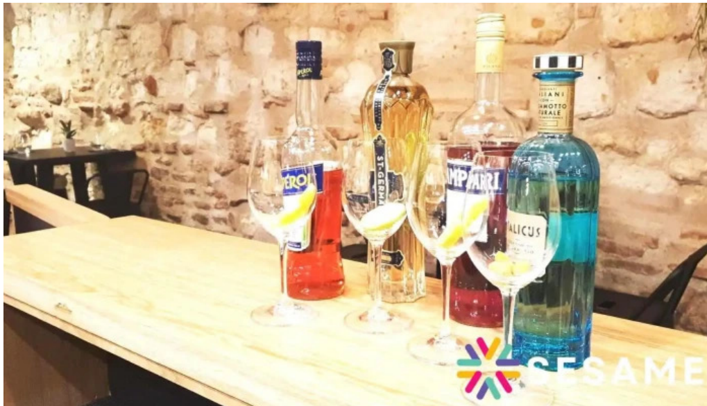
Arome plats et boissons