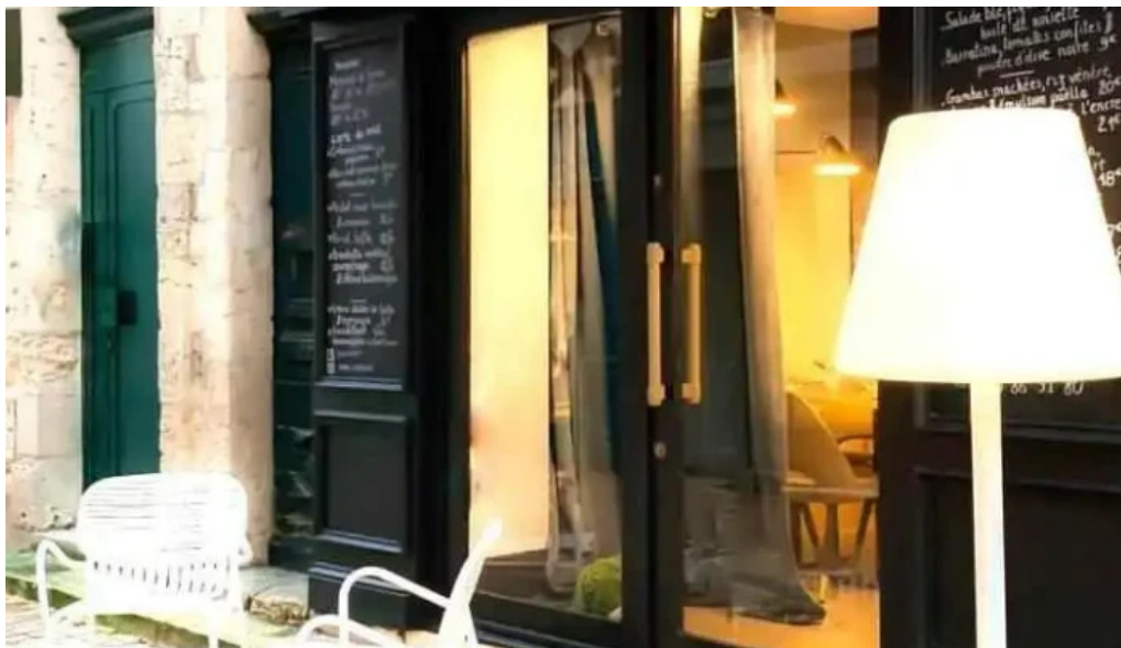
Arome photos du propriétaire