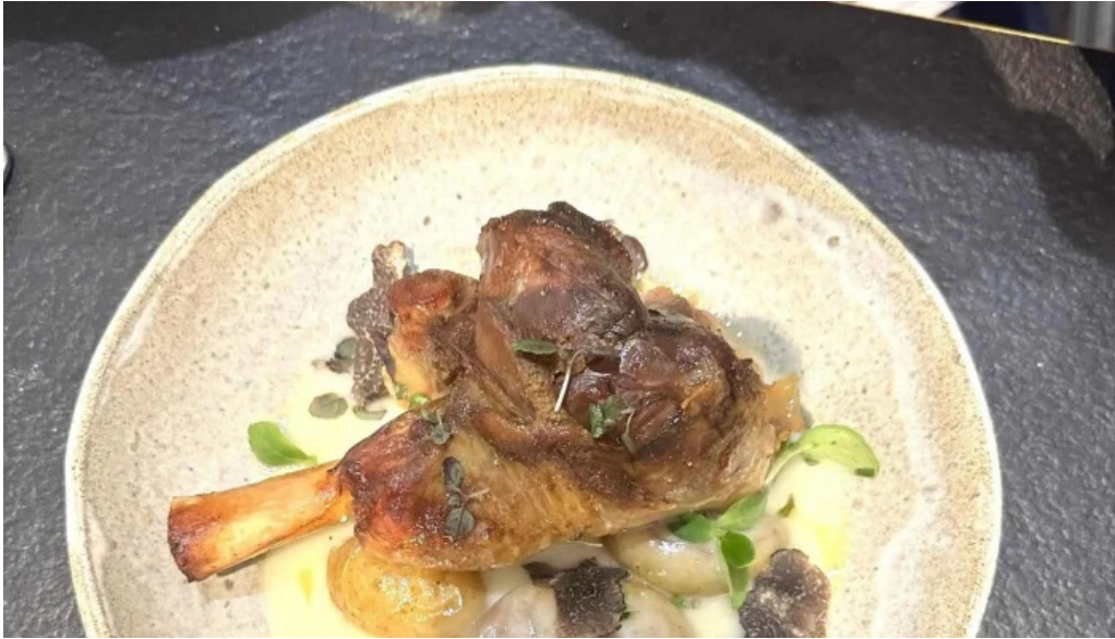
Arome ouvert maintenant