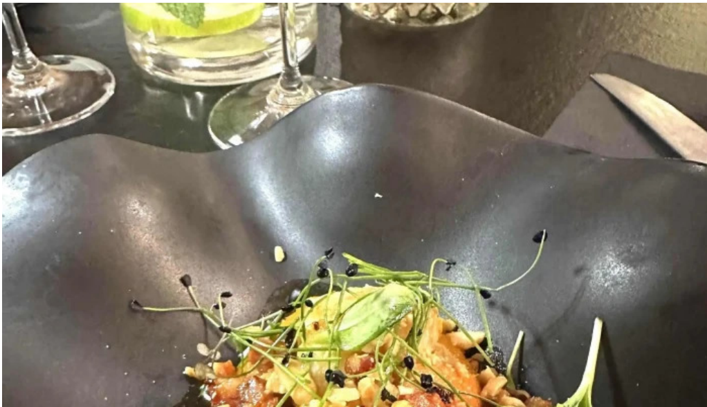
Arome restaurant gastronomique