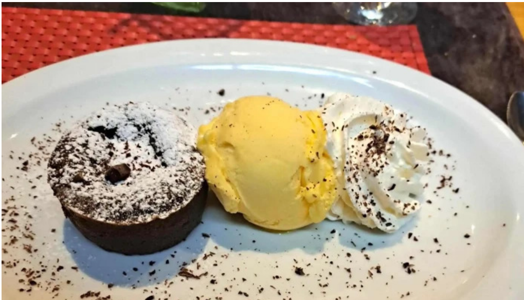
Restaurant la terrasse catalogue