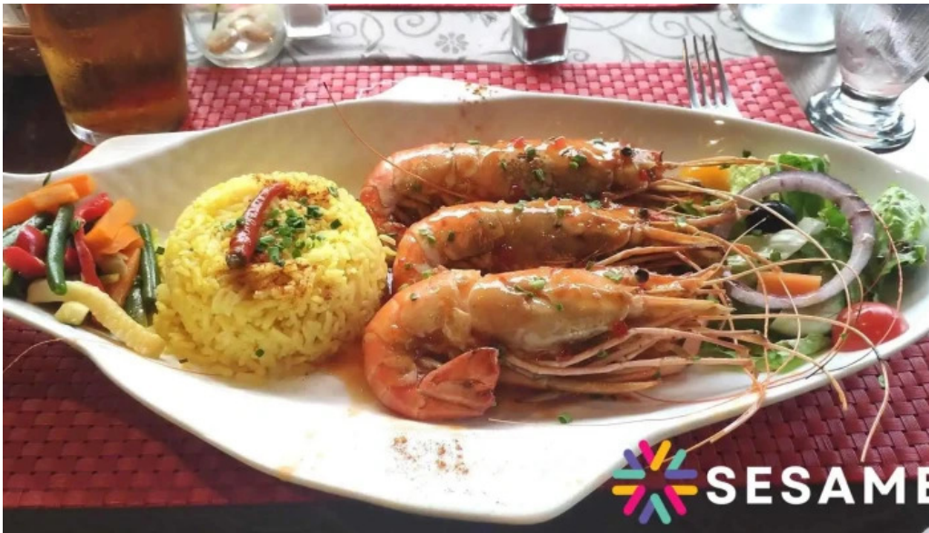
Restaurant la terrasse produits de la mer