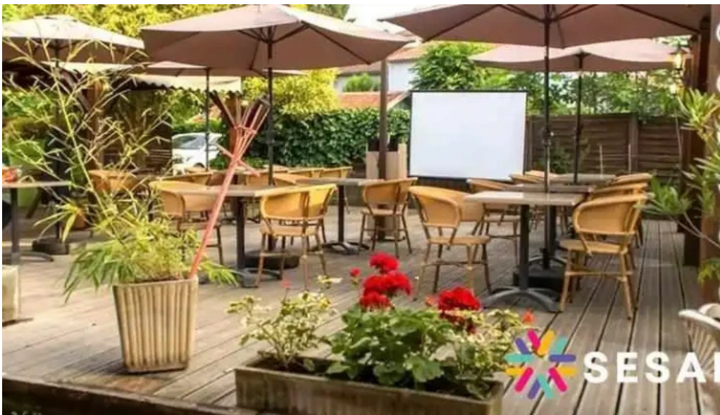
Restaurant la terrasse tout