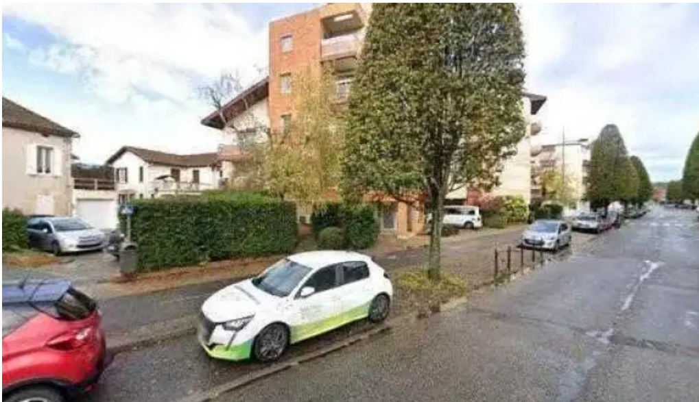
Restaurant la terrasse street view et 360deg