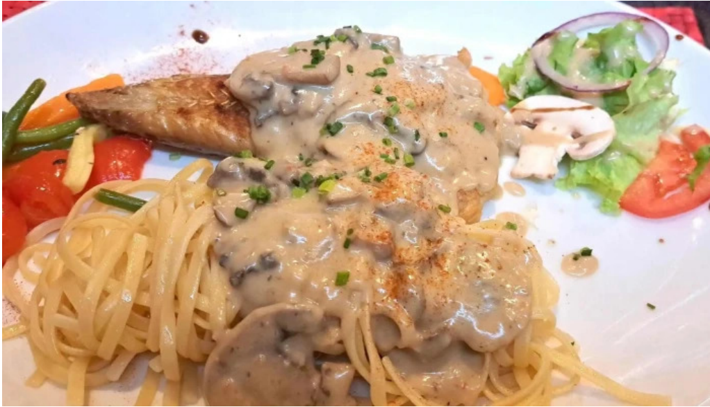
Restaurant la terrasse restaurant francais