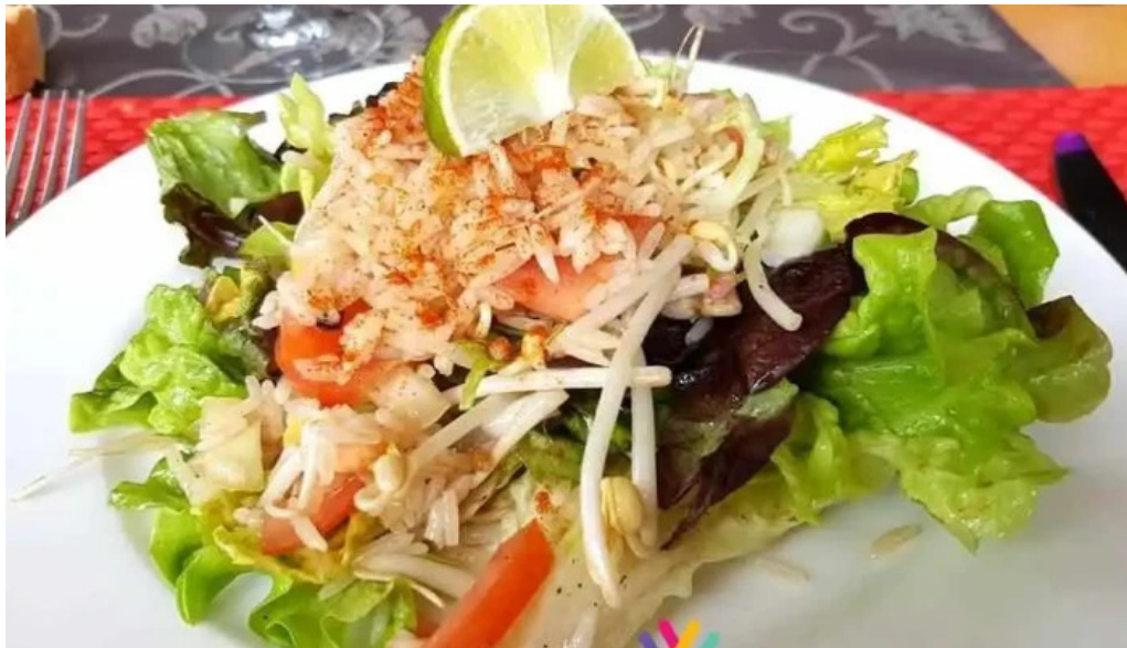
Restaurant la terrasse plats et boissons