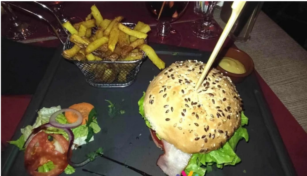
Restaurant la terrasse hamburger