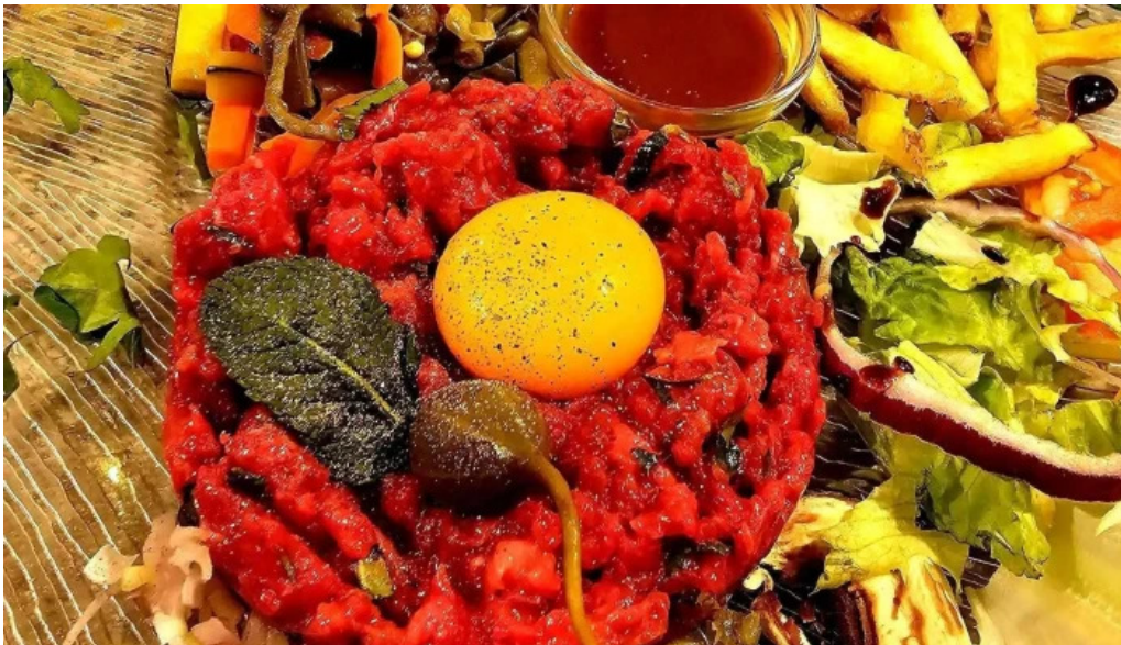
Restaurant la terrasse steak tartare