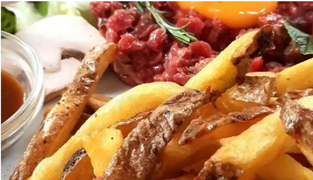
Restaurant la terrasse videos