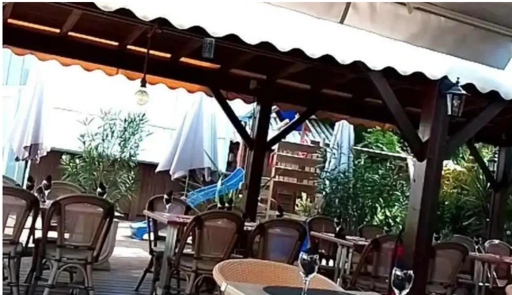
Restaurant la terrasse atmosphere