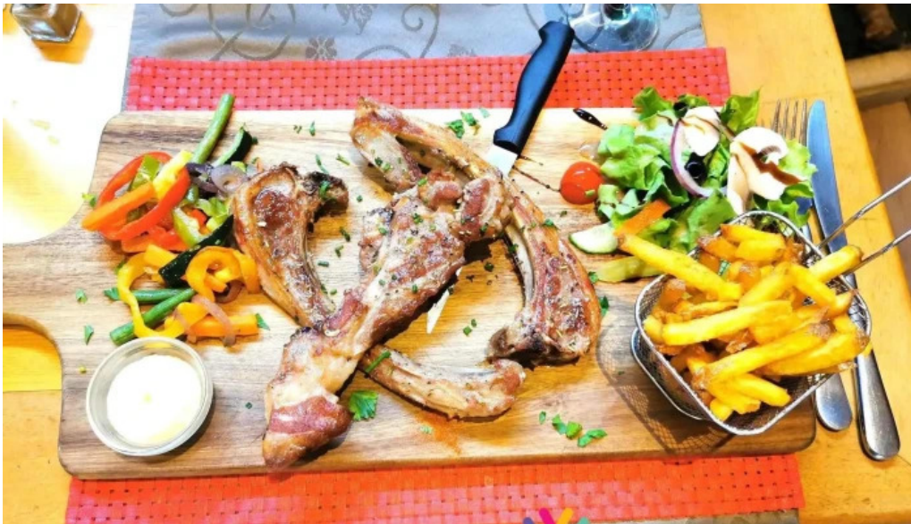
Restaurant la terrasse steak