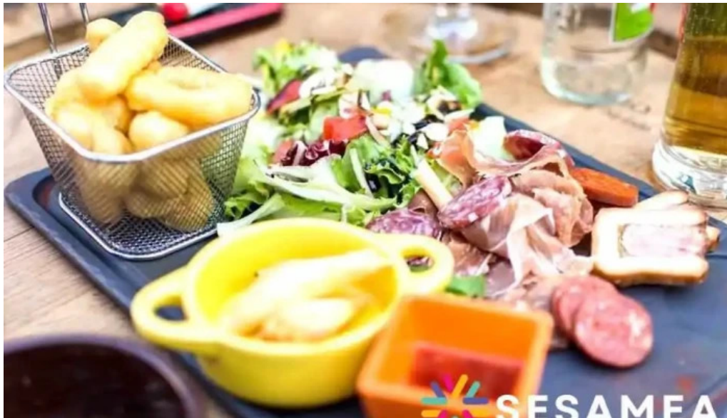
Restaurant la terrasse photos du propriétaire