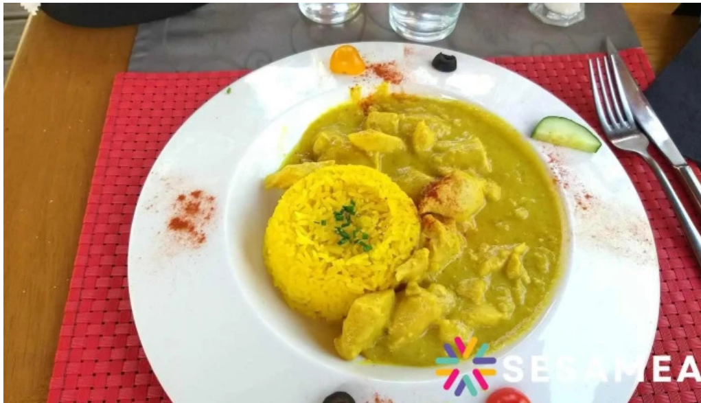
Restaurant la terrasse poulet au curry