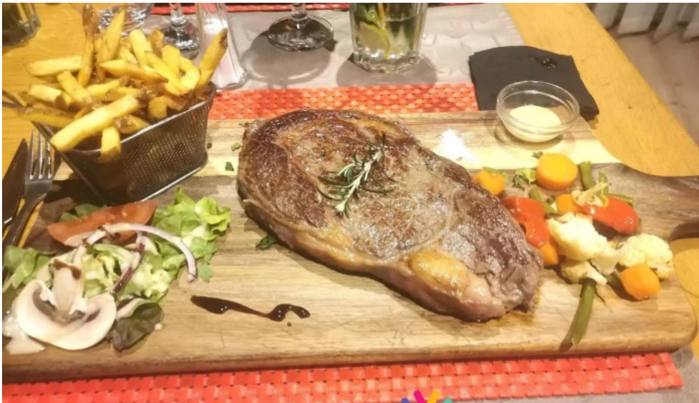
Restaurant la terrasse les plus recentes