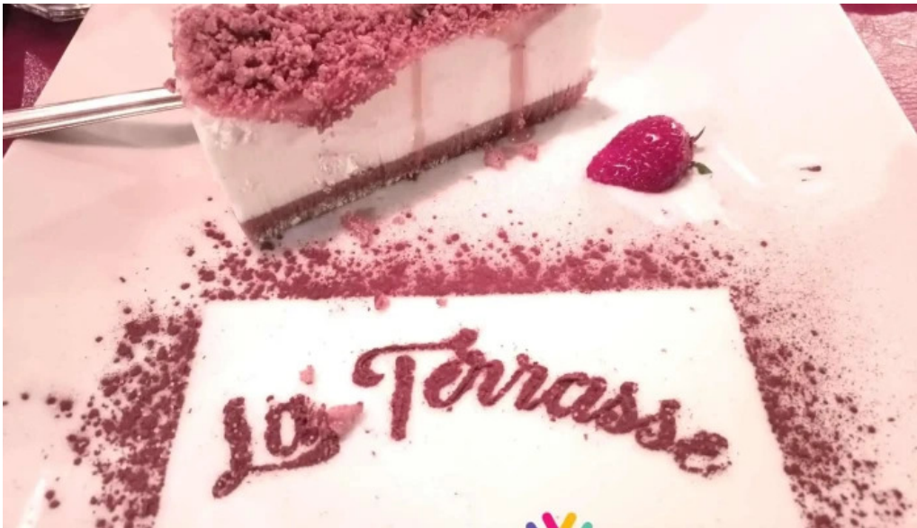
Restaurant la terrasse tiramisu