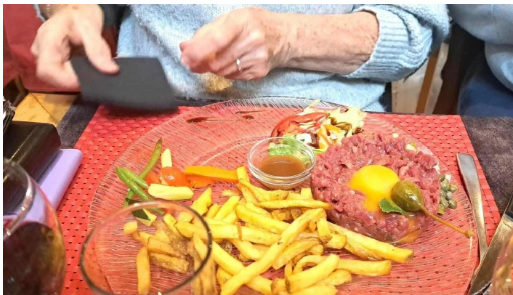
Restaurant la terrasse agen