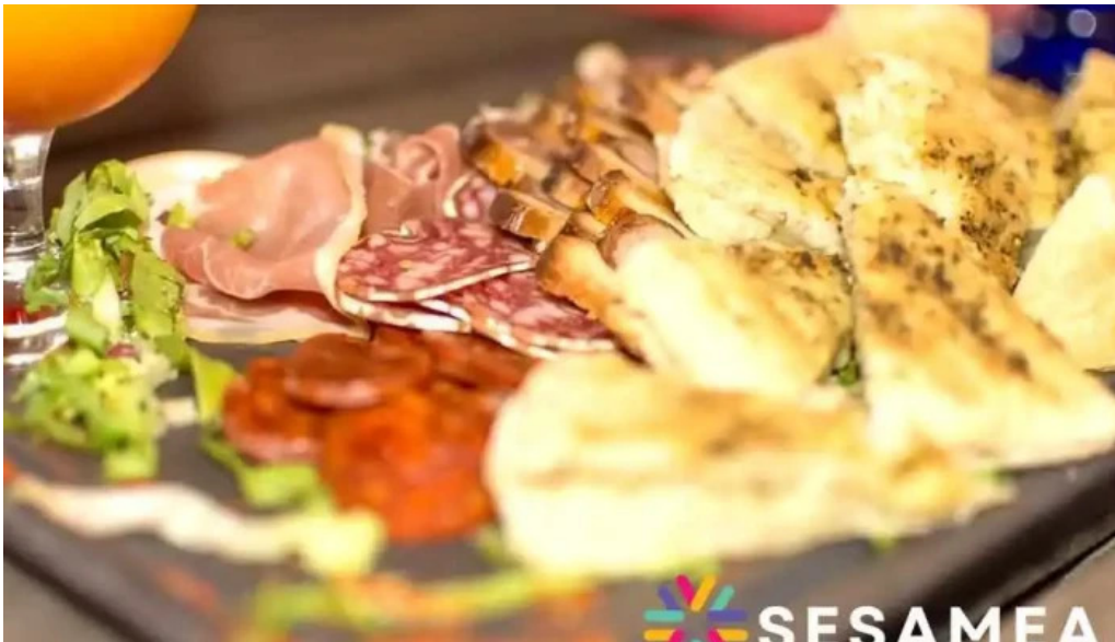
Restaurant la terrasse charcuterie