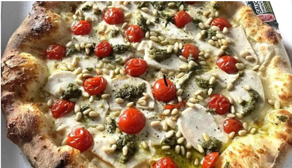
Eat rapizz ambes pizza