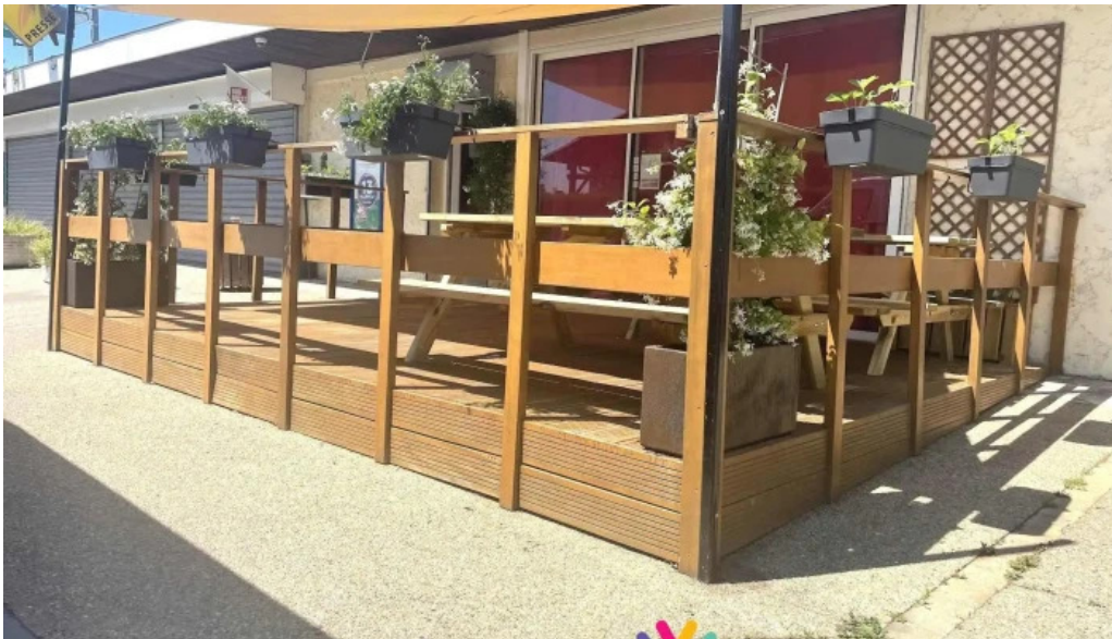
Eat rapizz ambes tout