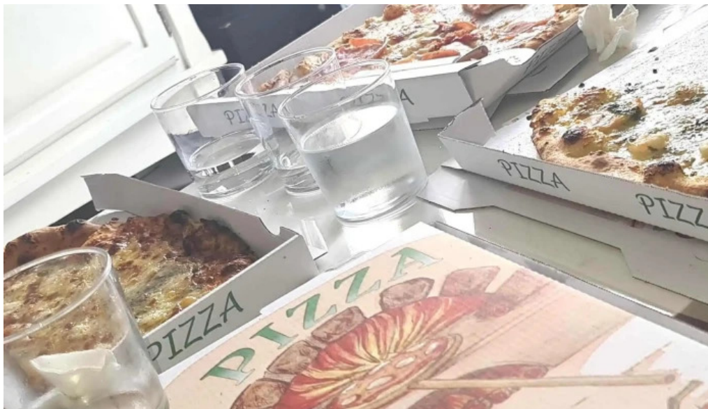
Eat rapizz ambes ambes