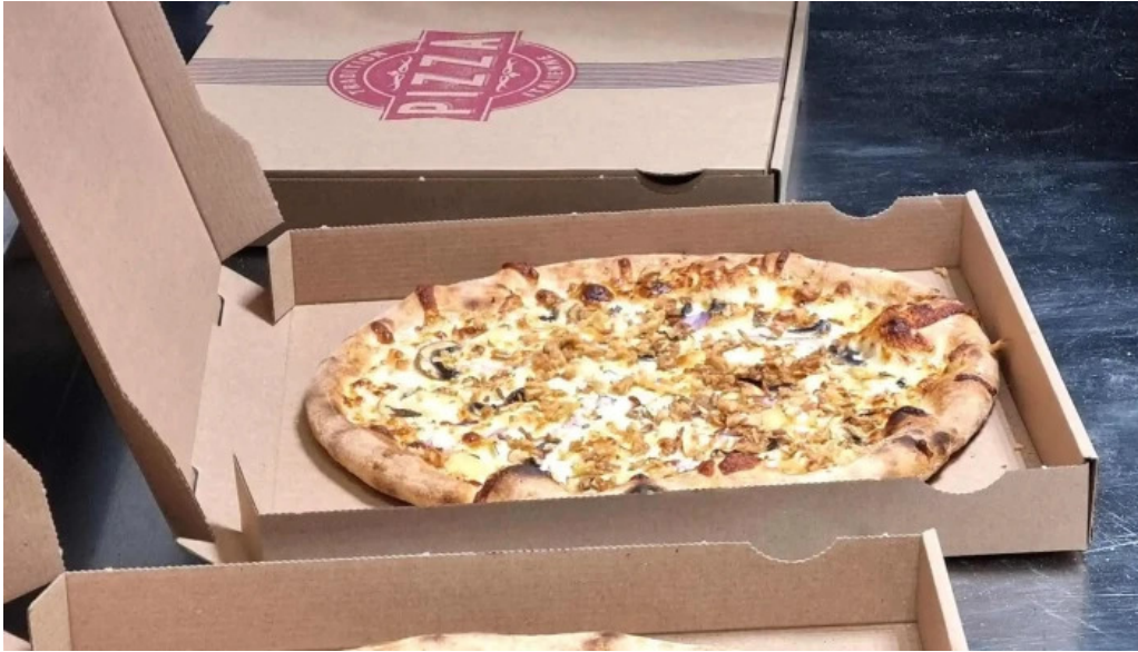
Eat rapizz ambes pizzeria