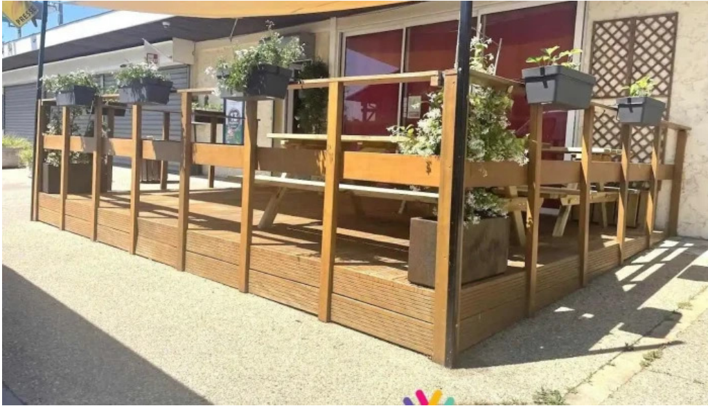
Eat rapizz ambes ambes