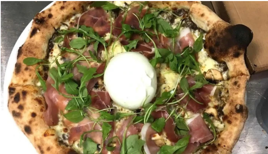
Eat rapizz ambes plats et boissons