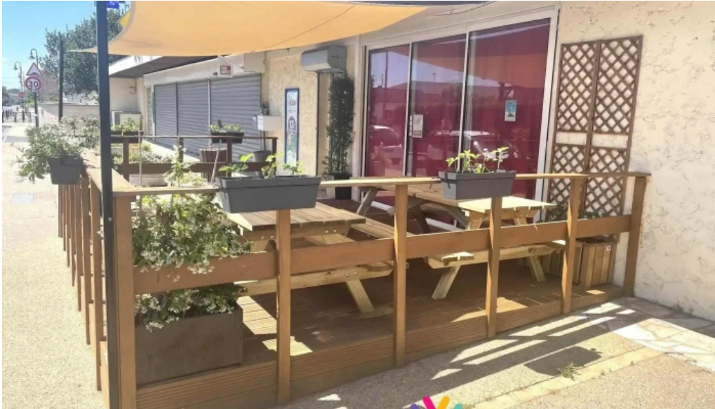
Eat rapizz ambes photos du proprietaire