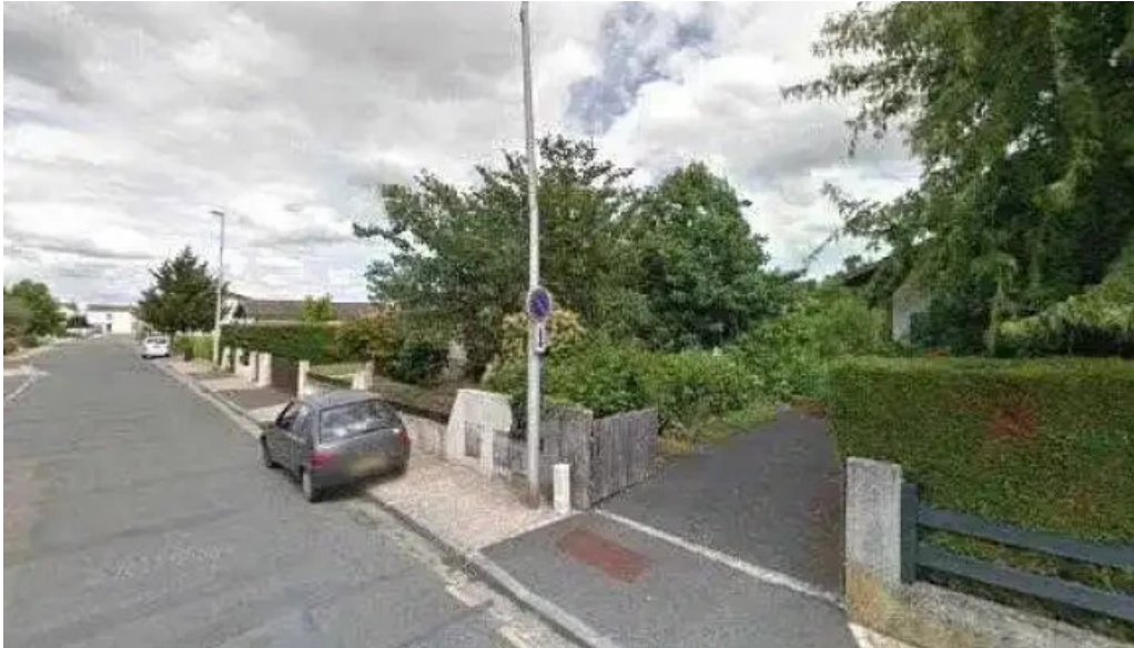
Eat rapizz ambes street view et 360deg