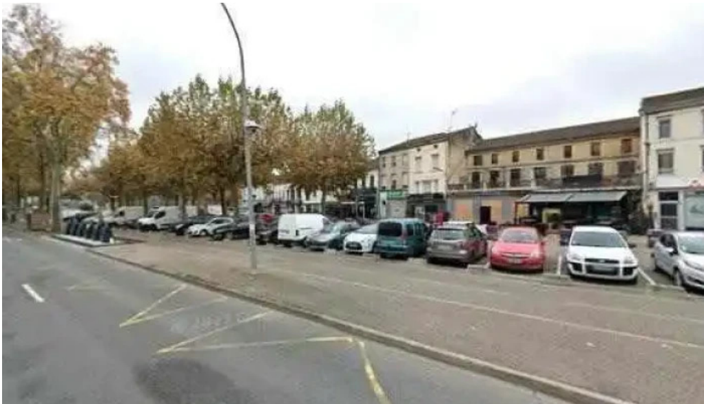
Linde street view et 360deg