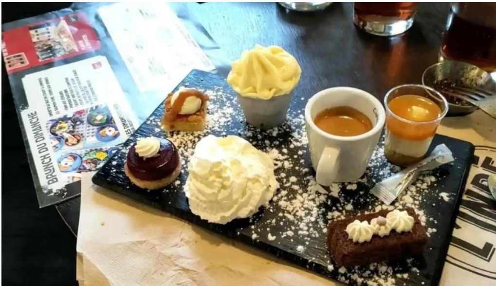
Linde les plus recentes