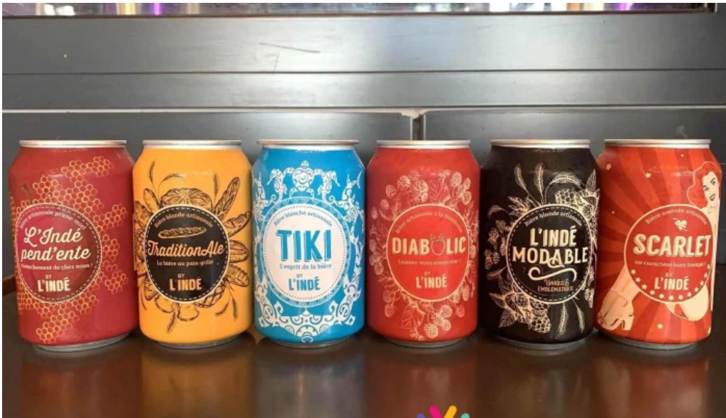
Linde plats et boissons