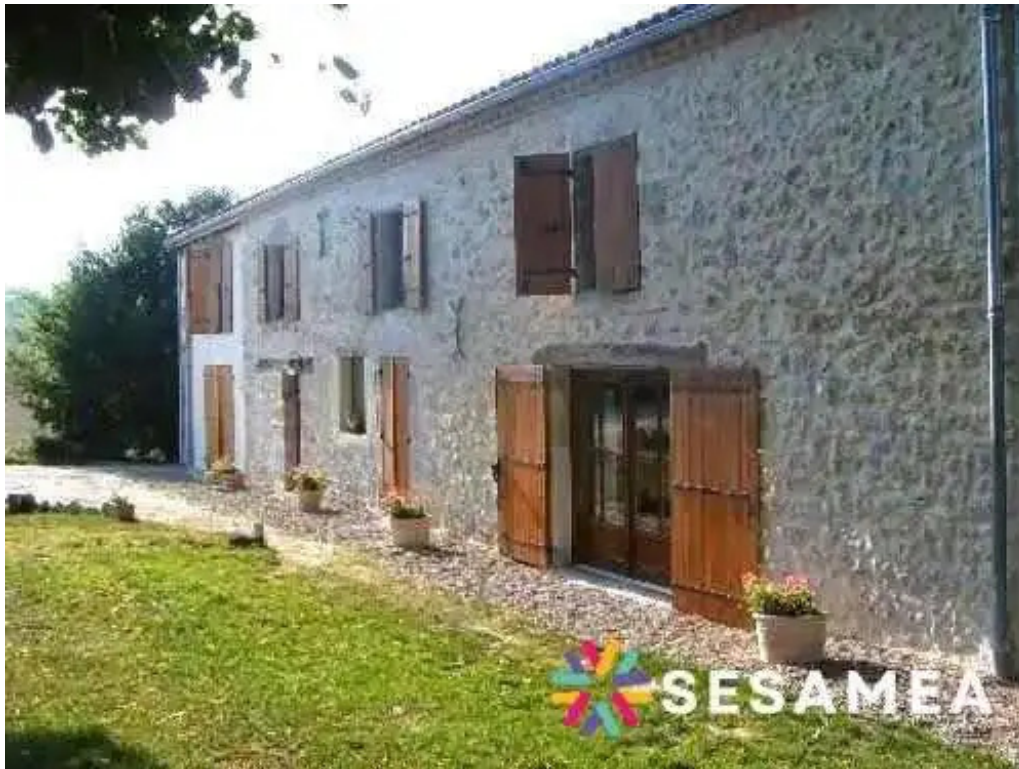
Le gargantua photos du propriétaire