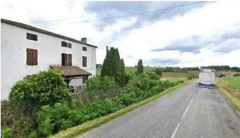
Le gargantua street view et 360deg