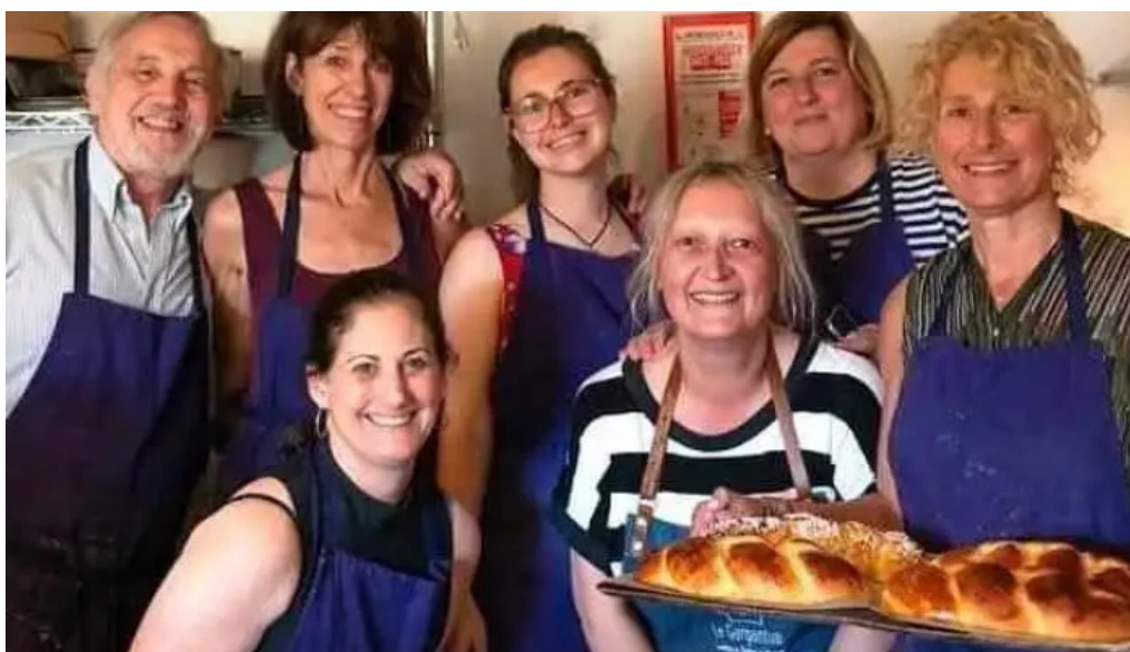
Le gargantua anzex