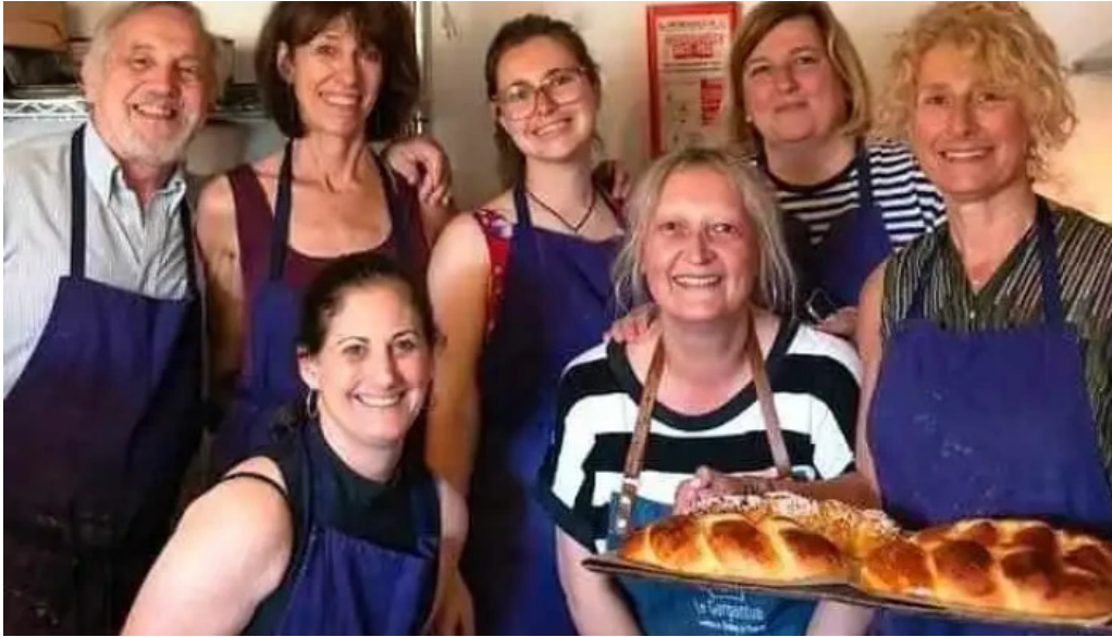
Le gargantua tout