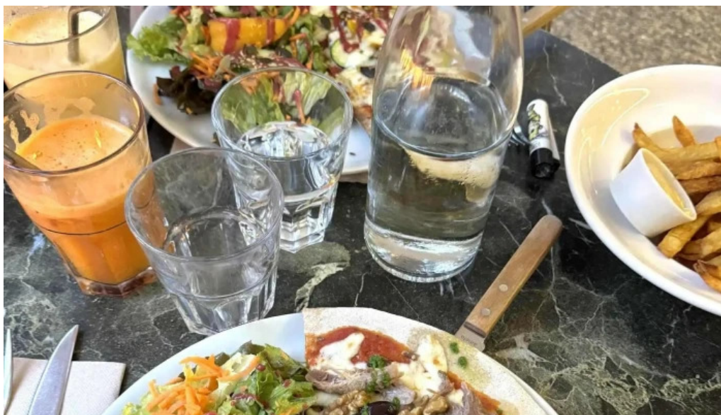
Au ptit bonheur brasserie populaire agen