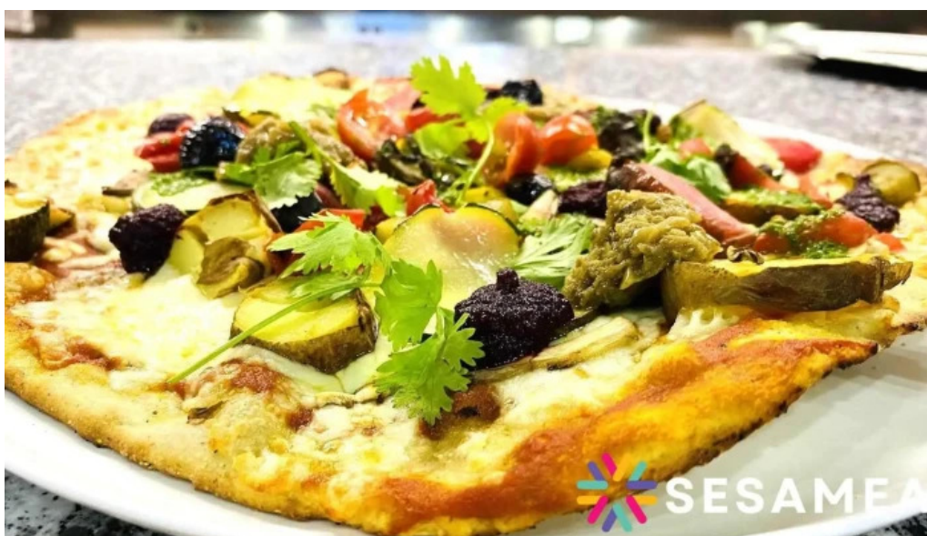
Au p tit bonheur brasserie populaire agen