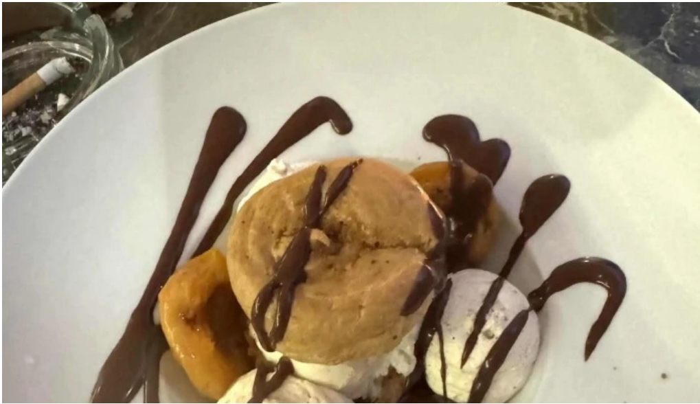
Au ptit bonheur brasserie populaire telephone