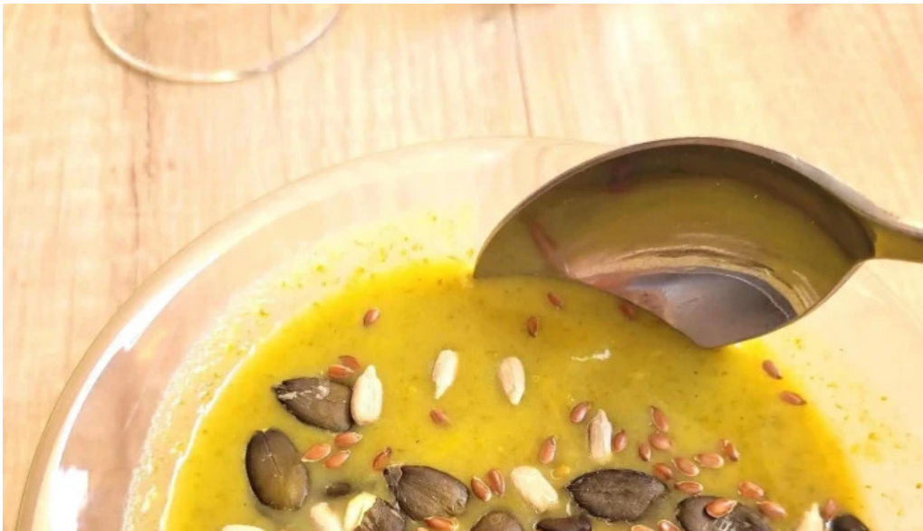
Au petit bonheur brasserie populaire catalogue