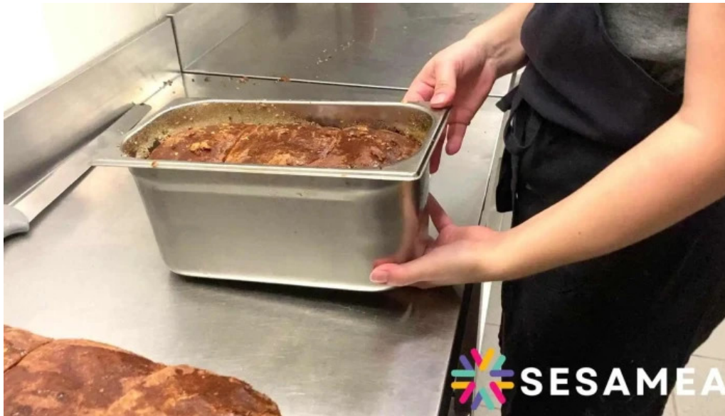
Au ptit bonheur brasserie populaire photos du proprietaire