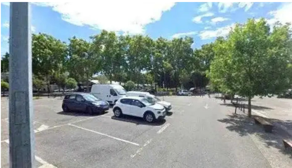
Au ptit bonheur brasserie populaire street view et 360deg