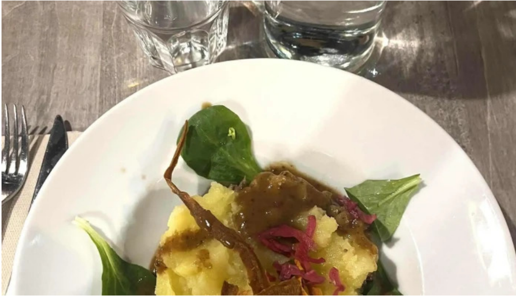
Au ptit bonheur brasserie populaire site web