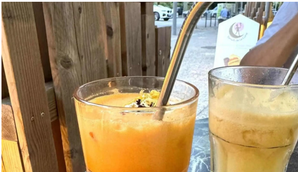
Au petit bonheur brasserie populaire brasserie