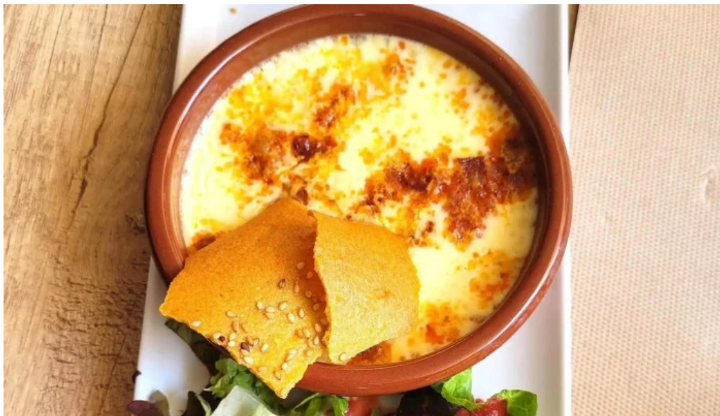
Au ptit bonheur brasserie populaire ouvert maintenant