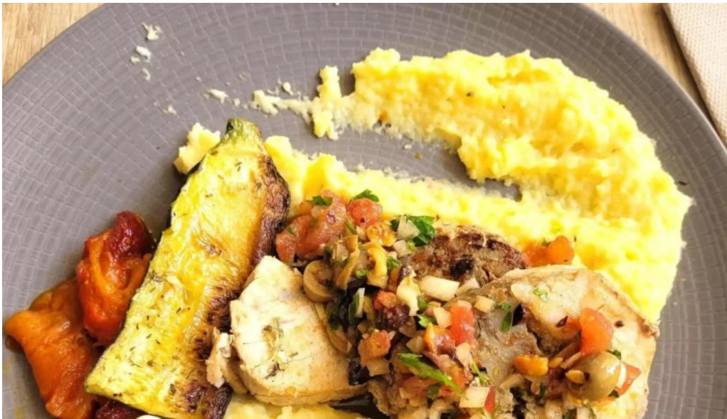
Au ptit bonheur brasserie populaire prix