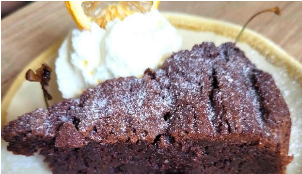
Au petit bonheur brasserie populaire opinions