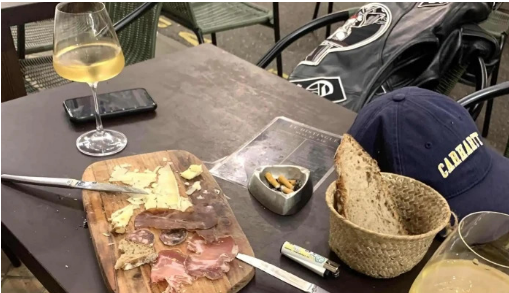
Le distingue instagram