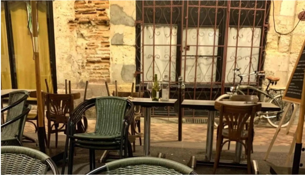
Le distingue comment arriver