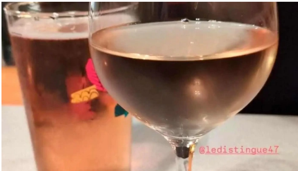
Le distingue les plus recentes