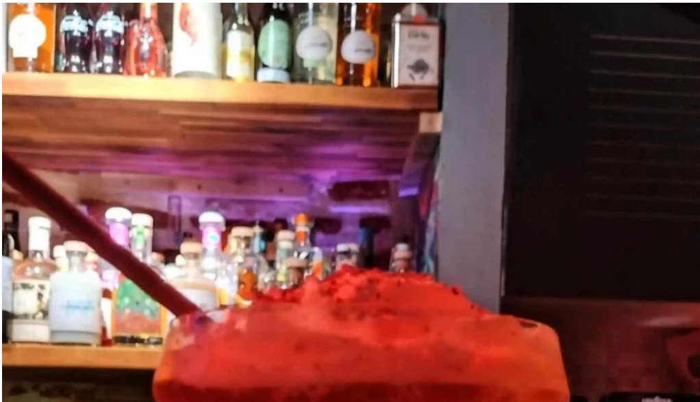
Le distingue agen