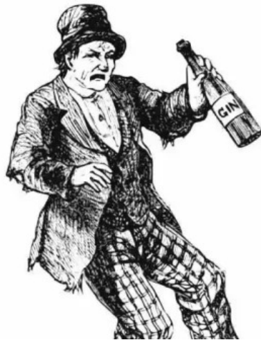
Le distingue photos du proprietaire