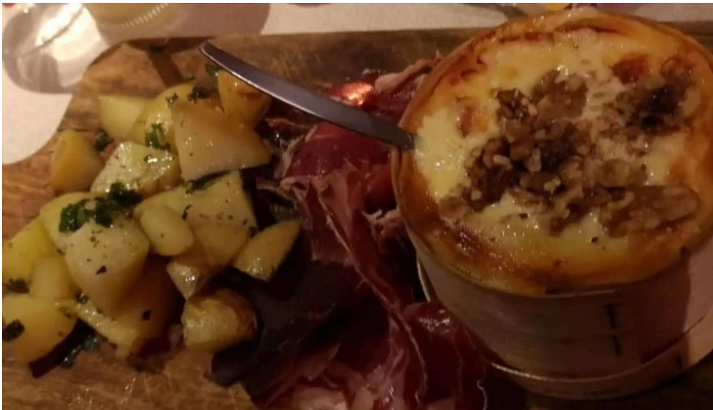
Le distingue emplacement