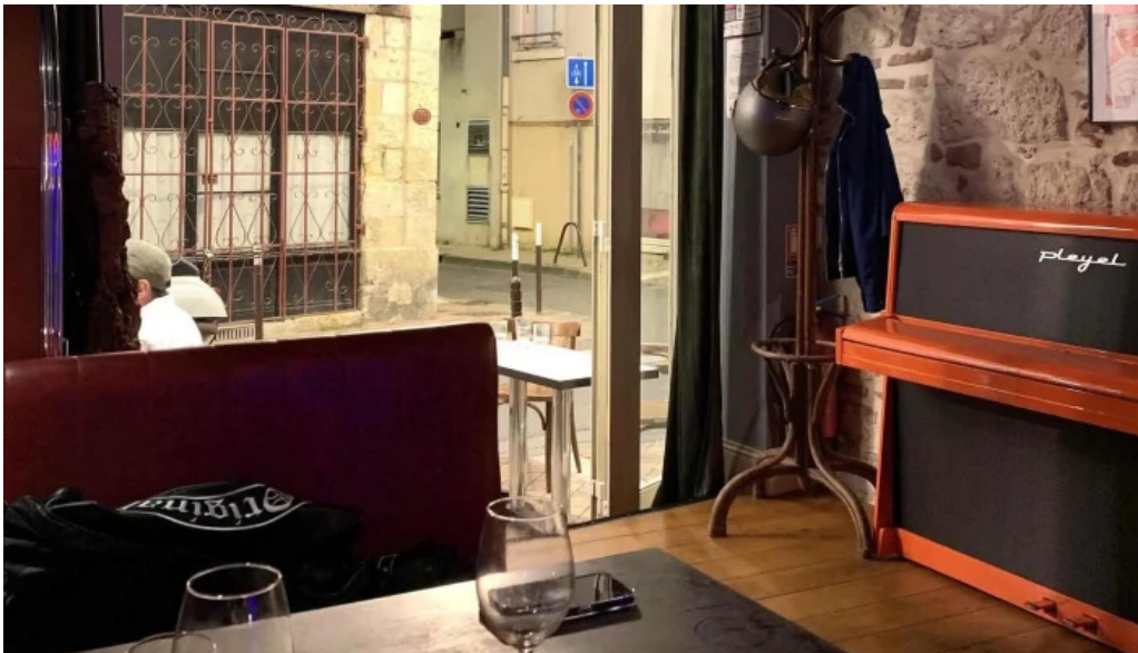
Le distingue catalogue