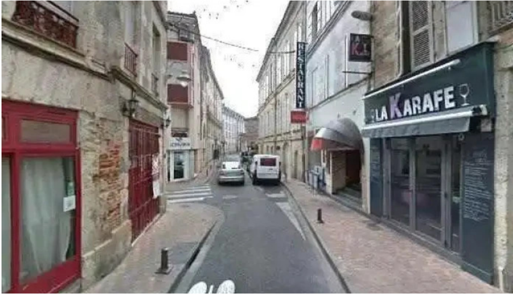
Le distingue street view et 360deg