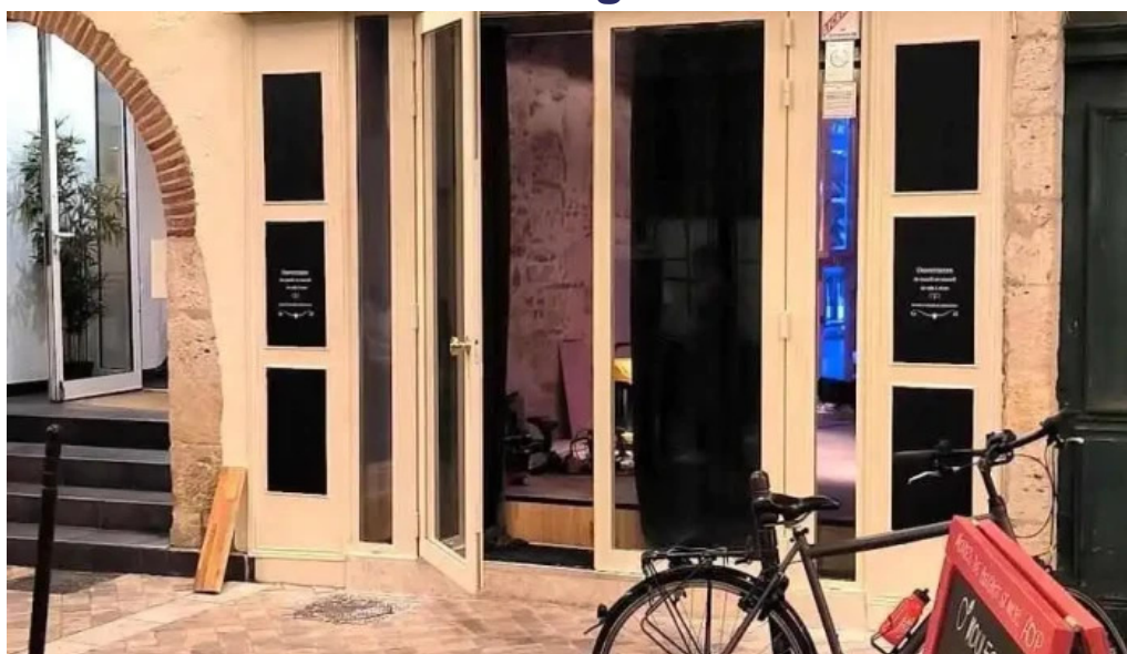
Le distingue tout