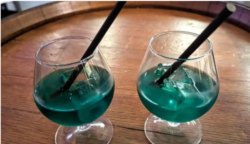
Le distingue plats et boissons