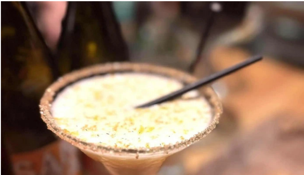
Le distingue bistro