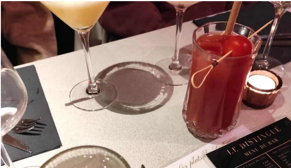
Le distingue prix