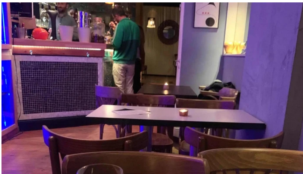
Le distingue adresse