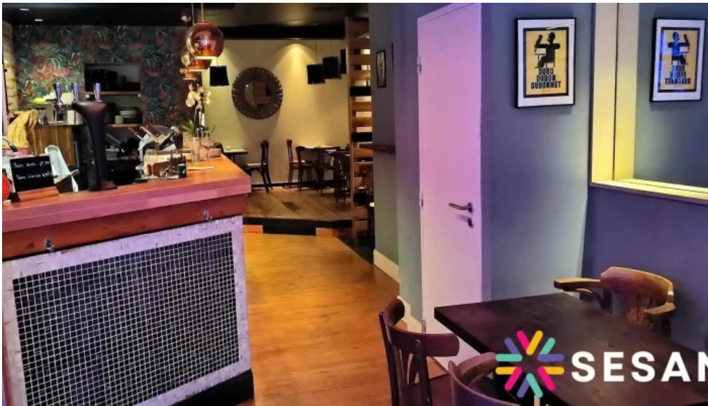
Le distingue atmosphere