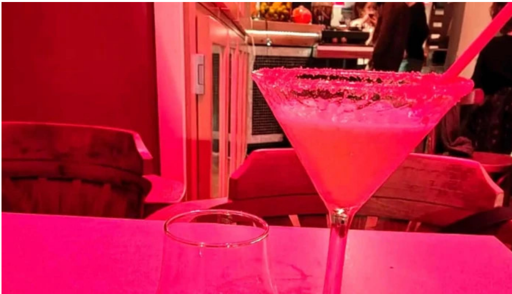
Le distingue promotion