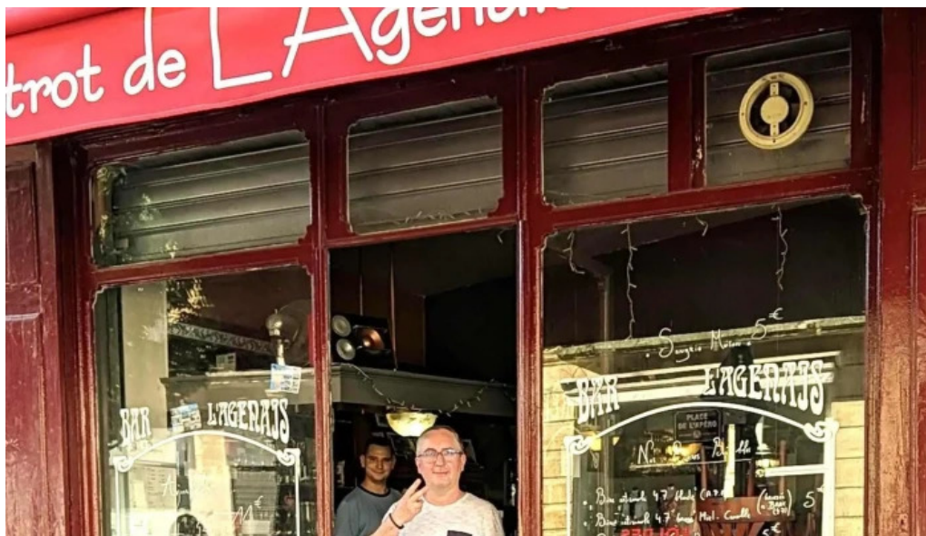
Le bistrot de l'agenais catalogue