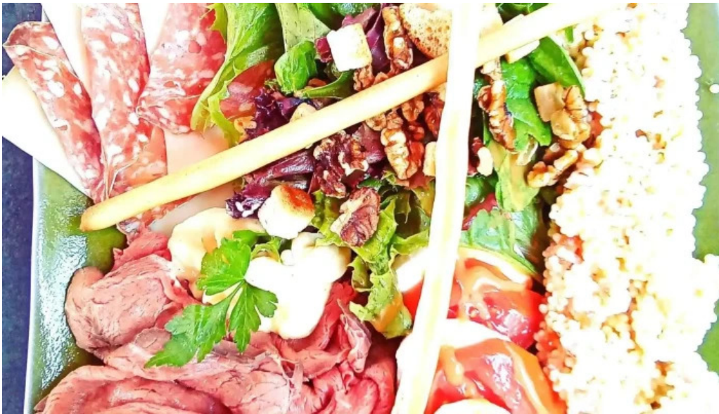
Le bistrot de lagenais plats et boissons