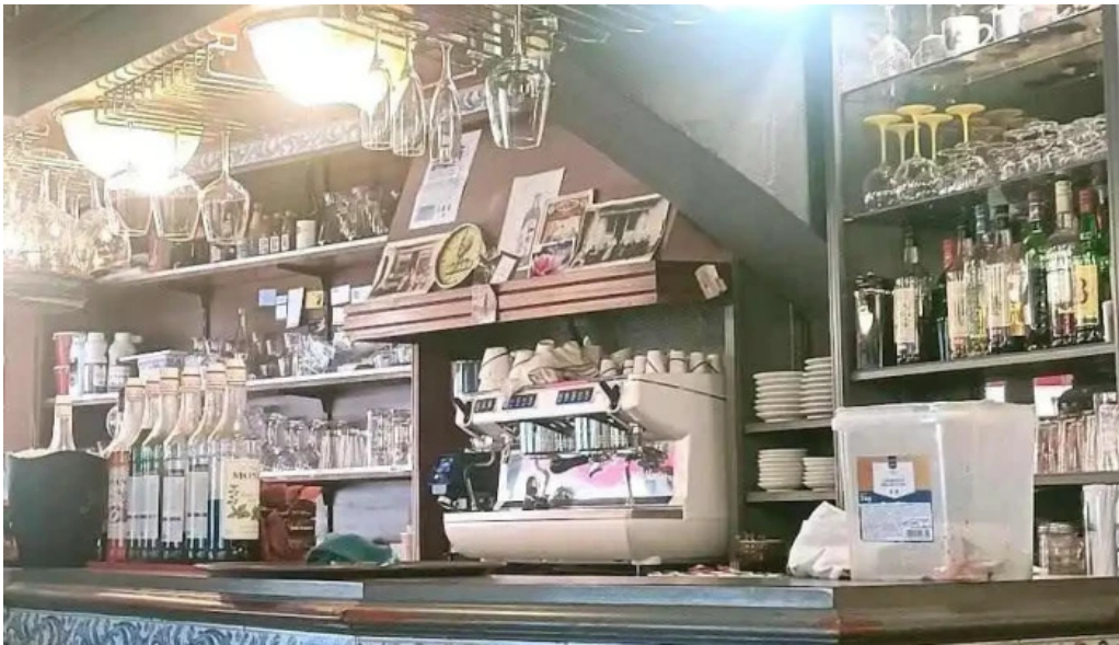
Le bistrot de lagenais atmosphere