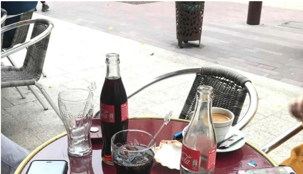
Le bistrot de lagenais ouvert maintenant