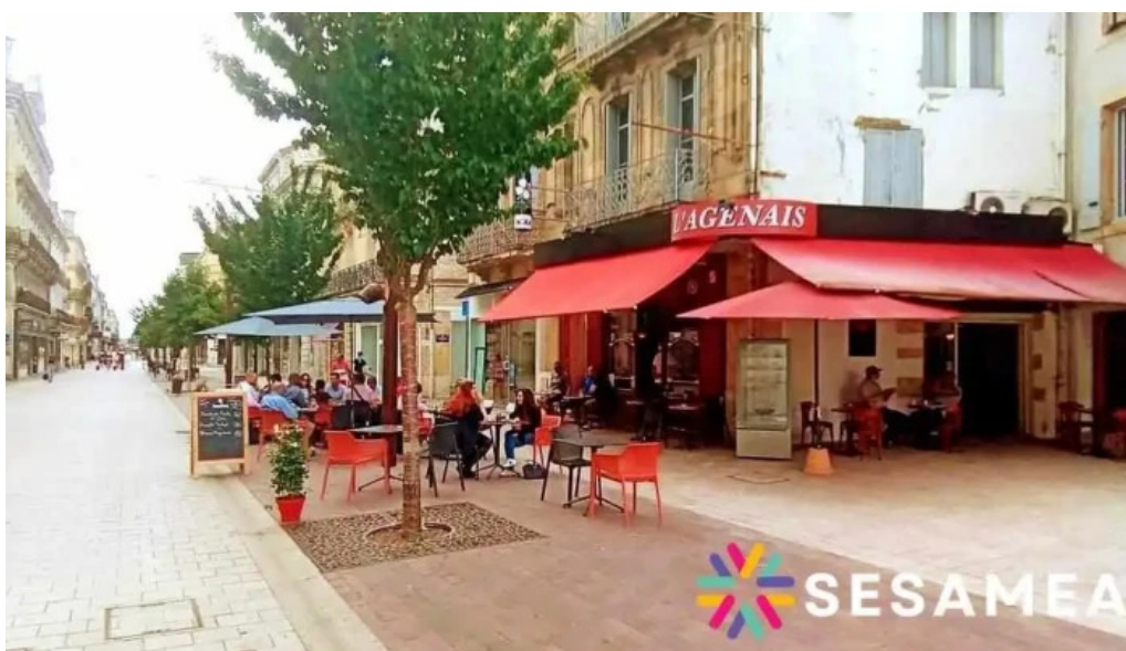
Le bistrot de l'agenais agen