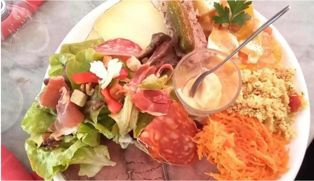
Le bistrot de lagenais photos du proprietaire