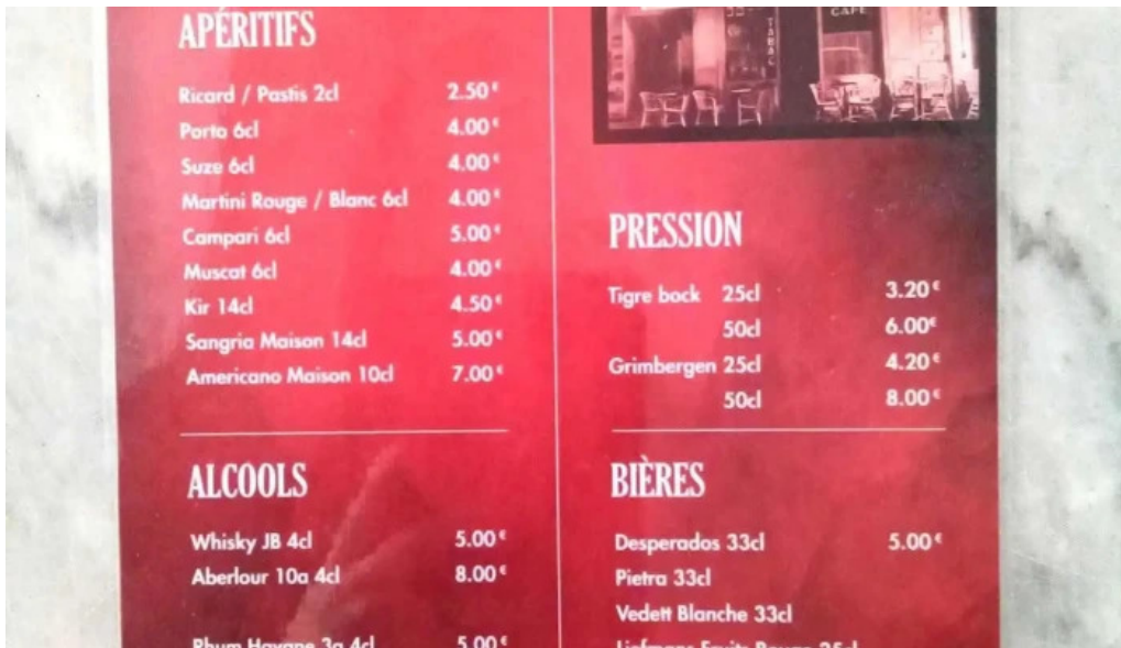
Le bistrot de lagenais menu