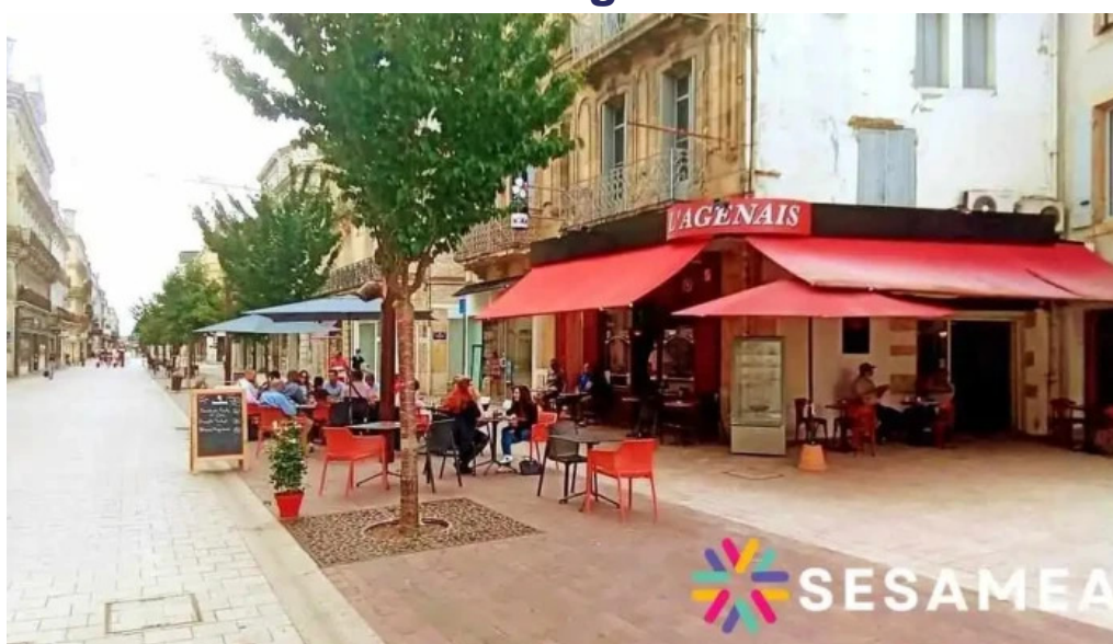
Le bistrot de l'agenais tout