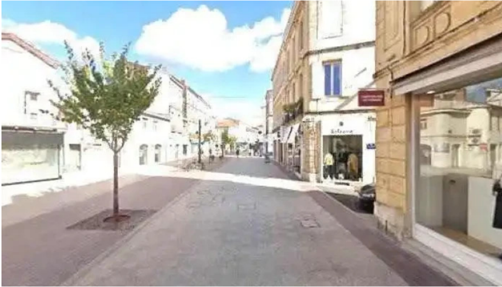
Le bistrot de lagenais street view et 360deg