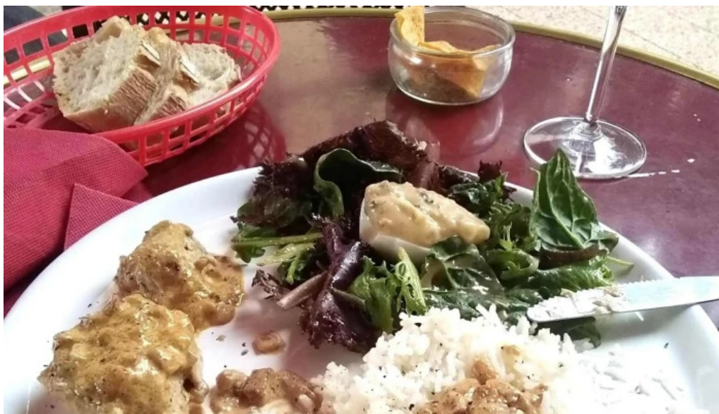
Le bistrot de l'agenais agen