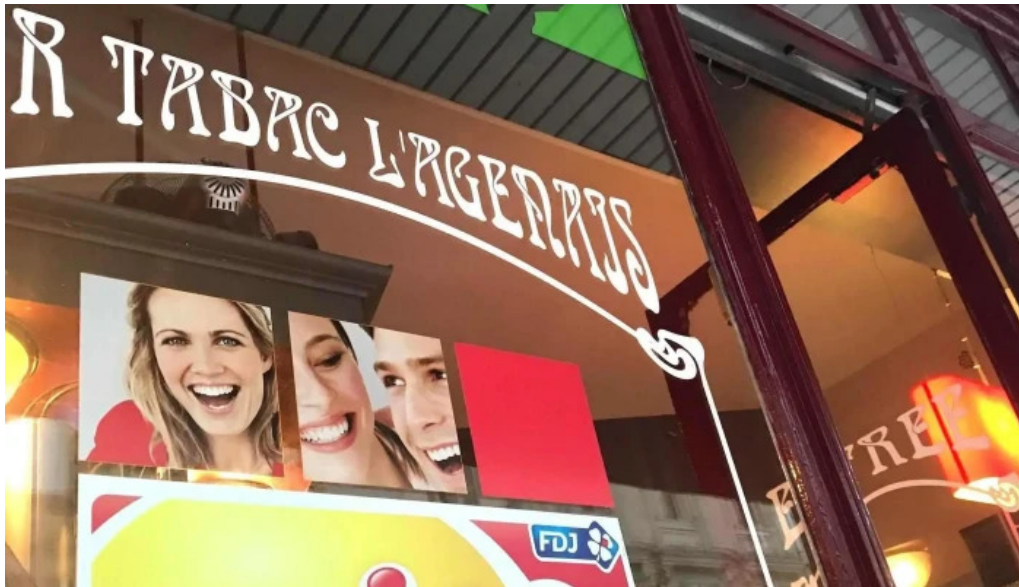
Le bistrot de lagenais ou