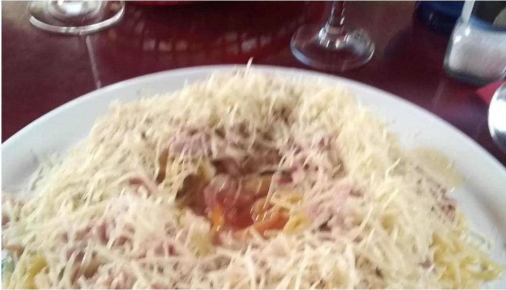
Le bistrot de lagenais bistro